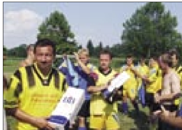
Športniki iz Čepinca pa Dolenjoga Sinika se srečüvlejo že več kak trestli lejt