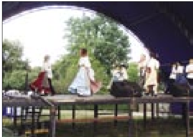
Na Festivalu dobrega sosetstva je nastopila tudi otroška folklorna skupina iz Števanovec