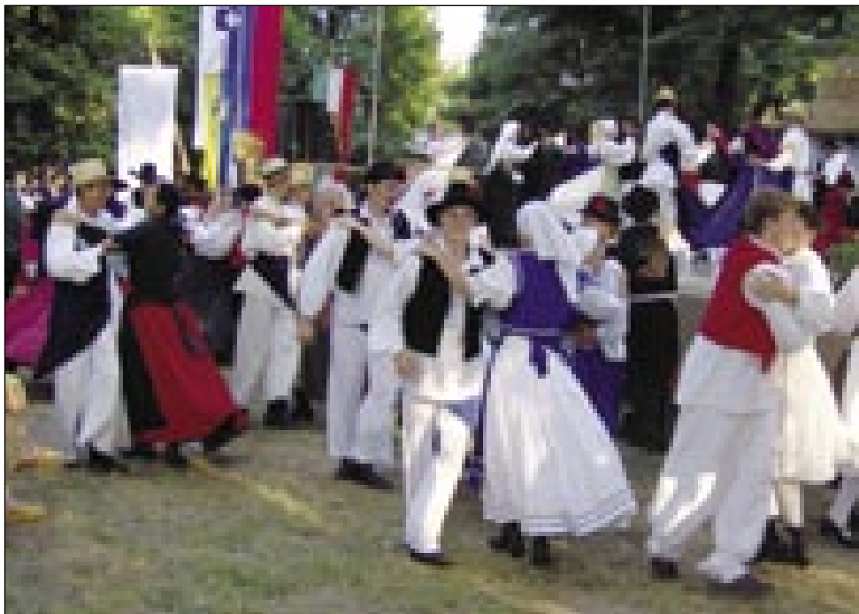
Na konci programa so se vküp zavrtele vse skupine

bili instrumenti Beltinške bande z napisom: Instrumen- ti naših glasbenikov, ki jih žal ni več med nami. Bila je vödjana harmonika, troben- ta, klarinet, gosli, kontrabas. Bila je tüdi razstava penez z