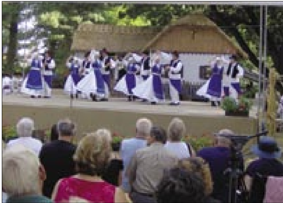
Senička folklorna skupina na odri beltinskoga festivala

V nedelo je biu drugi del festivala. Te je biu glavni den. Na te den so bile pozvane folklorne skupine, seniška folklorja tudi. Pred obödom so Seničarge poglednili razstavo fotografij (kejpvov) prekmurskih band in mužíkašov. Bili so kejpi od več band, depa največ kejpov je bilau od Kociprove (beltinske) bande od leta 1933 naprej. Npr. iz leta 1964, gda so špilali na premiciji v Lipovcaj, ali združena godba Kociper iz leta 1988. Člani Kociprove bande so že vsi mrli. Drügi mužíkaši so bili npr. Pleh banda iz Gančan