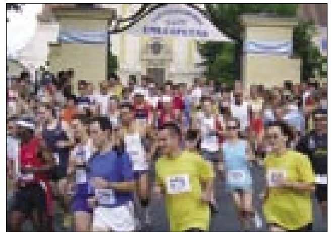
Teka v spomin na monoštrsko bitko se iz leta v leto udeležuje več tekačev