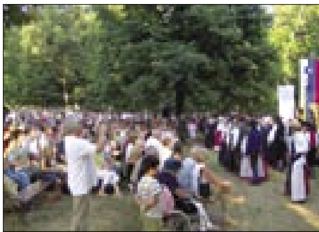
V beltinskem parki se na festivali zbere velka množica

opravljenom deli-žetvi. Naši predniki so žmetno delali v vsakdanešnjom življenji. Konec zime, potistom sejanje, žetev in s tem spravilo pridelka, na šteroga so čakali cejlo leto. Zadišali so kolači, spe-