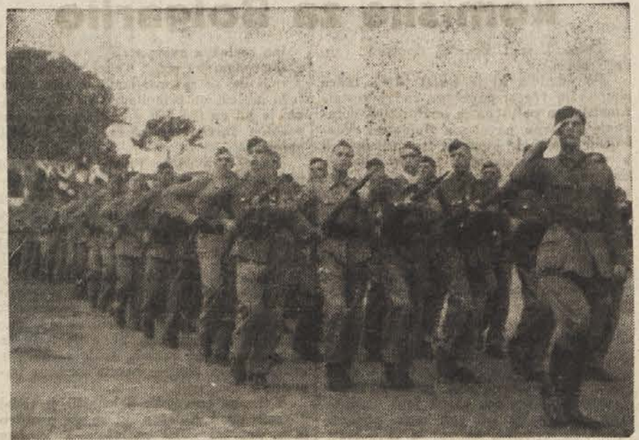
Borci Gubčeve brigade v paradnem maršu na proslavi četrte obletnice njene ustanovitve.