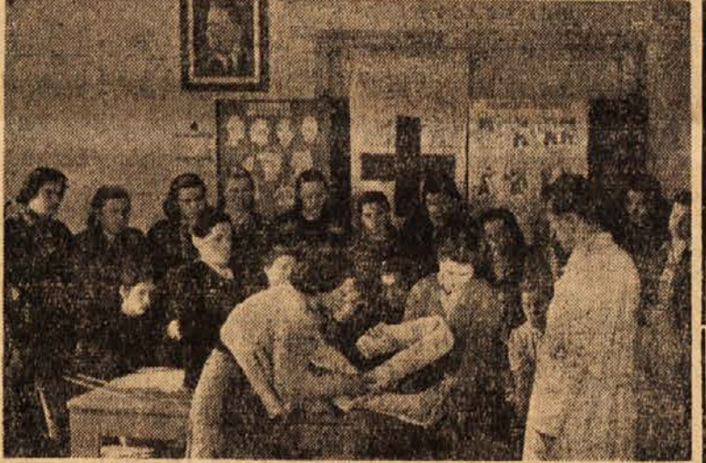
Dekleta pri praktičnem ponku v tečaju Rdečega križa

Da bi omilili stanovanjsko stisko, si mestni ljudski odbor prizadeva ter pomaga tudi zasebnikom, ki go so odločili za zidanje manjših stanovanjskih hiš. Občina ima letos v načrtu gradnjo srednje velikega stanovanjskega bloka, ki naj bi ga zidali na stavbišči bivše sinagoge. Vendar pa še vedno ne vedo, kako bo zaradi donarja. Več, seveda onostanovanjskih hiš, pa bodo zidali privatniki, ki imajo zbranga že precej gradbenega materiala. Občinski ljudski odbor pa jim ne more dati gradbenega dovoljenja, ker še nimajo regulacijskega načrta. Na zborih volivcev in na nešteto stankih SZDL je bilo že večkrat obljubljeno, da bodo izdelavo regulacijskega načrta pospešili, vendar se zdi, da dela stojijo. Sobotani sicer vedo, da je treba zanj časa in prav, vendar menijo, da bi se lahko bil gotov. Sebe ko bodo imeli načrt, bodo lahko izdali več gradbenih dovoljenj. S tem bi dokaj omilili stanovanjsko stisko v Murski Soboti. H. B.