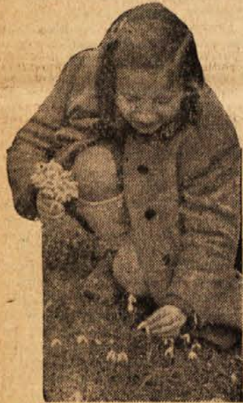
Naj ga utrgam?

Nad pisanim travnikom so vzletavali metulji. Od cveta do cveta so letali, od marjetice k spominčici, od spominčice k travniškemu klinčku, sedali so na