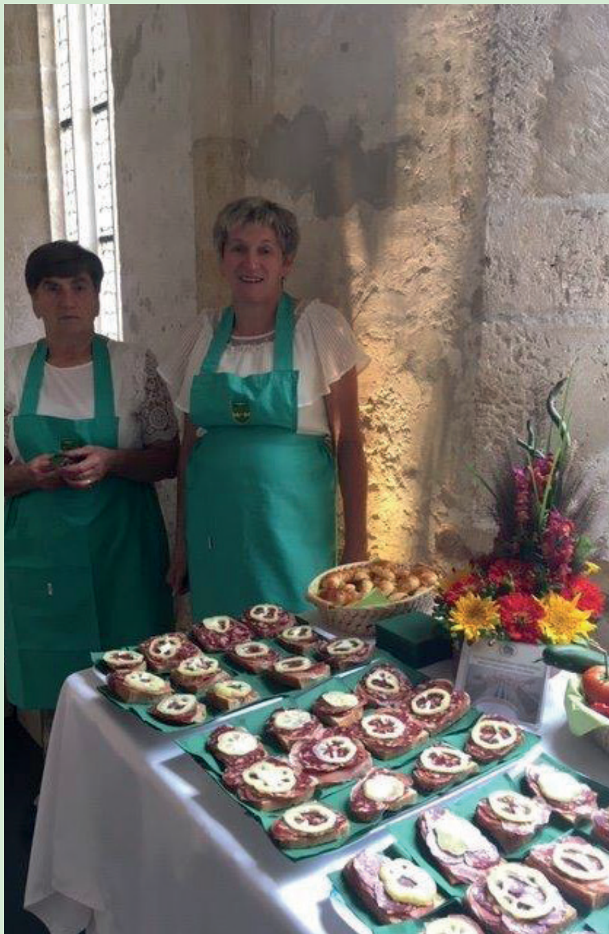
20. obletnica SOU Ptuj.

Skupna občinska uprava (SOU) občin v Spodnjem Podravju letos slavi 20. obletnico delovanja. Delo SOU povezuje 22 občin, zato je bila v sklopu tega jubileja organizirana osrednja prireditev, ki je potekala v sredo, 18. septembra 2019, v Dominikanskem samostanu na Ptuj. Pričela se je z okroglo mizo z naslovom »Zagotavljanje zdrave pitne vode na območju Spodnjega Podravja«, ki je potekala med 11. in 13. uro. Na njej so sodelovali tudi predstavniki Ministrstva za javno upravo in Ministrstva za okolje in prostor. V nadaljevanju je sledila osrednja proslava in nato tržnica občin z izbrano kulinariko. Na njej je sodelovala tudi naša občina s ponudbo suhomesnih izdelkov in domačim kruhom, ki jo je pripravilo Društvo podeželskih žena občine Žetale, ter vinom našega vinarja Plajnska. Mizo, na kateri so ponujali navedene dobrote, so zelo lepo okrasili s cvetnim aranžmajem v izvedbi