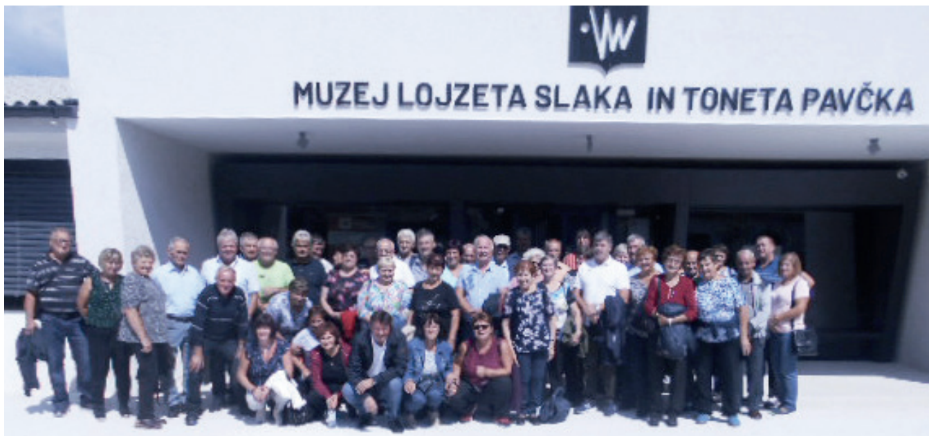
Članice in člani DU Žetale pred Muzejem Lojzeta Slaka in Toneta Pavčka v Mirni Peči, 3. 9. 2019

rodno-zabavne glasbe in Tone Pavček na področju literature. Muzej, ki ga je Občina Mirna Peč uredila s pomočjo evropskih sredstev, je resnično vreden ogleda. Na dvorišču pred muzejem vzbudi pozornost obiskovalcev zadnji osebni avtomobil Lojzeta Slaka znamke audi, ki ga je družina Slak prodala (podarila) muzeju za 1 evro. V samem muzeju nas prijazen vodič vodi skozi vsa obdobja življenja Lojzeta Slaka in Toneta Pavčka. Osrednje mesto v muzeju ima »frajtonerca«, ki je Lojzetu Slaku prinesla nesmrtno slavo. V vitrinah tega muzeja je moč videti osebne predmete, fotografije, plošče, kasete. Posebej seže v srce njegov citat, v katerem je zapisal: »Ko ne bom mogel več igrati, bom umrl.« Tako se je tudi zgodilo na septembrski dan pred osmimi leti, ko se je Lojze Slak poslovil od tega sveta, vendar njegove viže živijo naprej ...