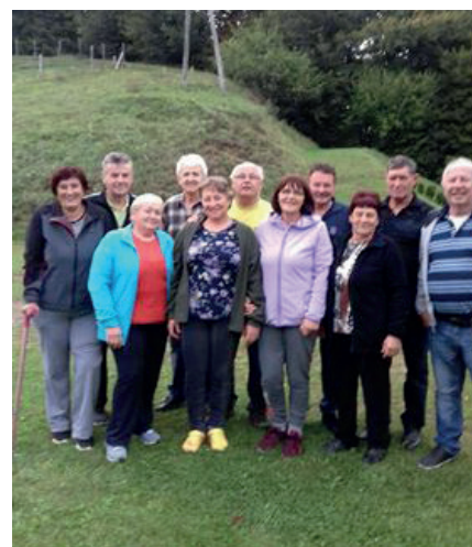
Udeleženci Turnirja v »ruskem kegljanju«, Zalopata, 24. 9. 2019