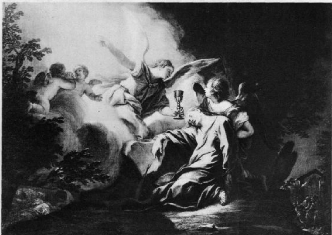
Na Oljski gori