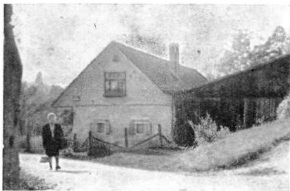
Pri Zanetu na Klanču je delovala prva kranjska ciklostilna tehnika

Šele z marcem 1945 so se razmere tudi na kamniškem operacijskem sektorju Kokrškega odreda spet toliko uredile, da so jeli znova razmišljati o političnem delu. Spremenjeni politični položaj je zahteval naglo vplivanje