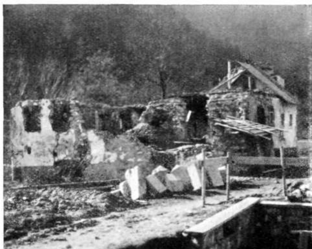
Ruševine požganega Vešterskega mlina, kjer je decembra 1945 do februarja 1944 delala partizanska tehnika. (Original v Loškem muzeju.)