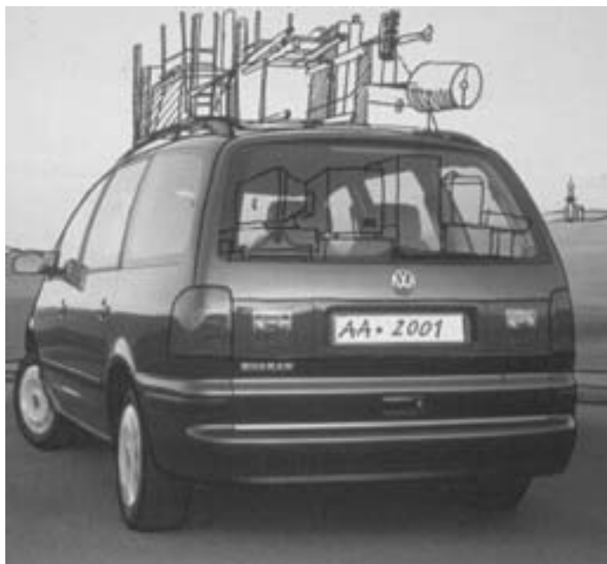
Slika 1: Peter Marolt: S trebuhom za kruhom, 2001