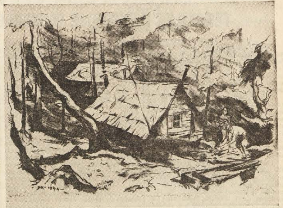
Božidar Jakac: Partizanska bolnica (litografija)

Božidar Jakac se je rodil leta 1899 v Novem mestu. Po končani akademiji v Pragi je bil leto dni v Parizu ter nato v večjih in manjših presledkih potoval po Afriki, Ameriki in Norveški. Po povratku iz Amerike je s pok. Miranom Jarcem izdelal potopisni knjigi »Odmevi rdeče zemlje« s številnimi ilustracijami. Sedaj je