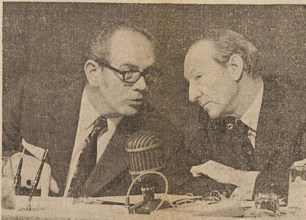
VODSTVO ZDRUŽENIH NARODOV — Na sliki vidimo predsednika glavne skupščine ZN (na levi) Poljaka Stanislaw Trepczynski in glavnega tajnika ZN Avstrijca Kurta Waldheima.

Od potnikov in posadke je bilo rešenih 19 oseb, 34 pa jih je utonilo verjetno z letalom vred. To se je potopilo, ko je vdrla vanj voda. Letalo japonskega izdelka YS-11A je bilo na poti s Krfa v Atene.