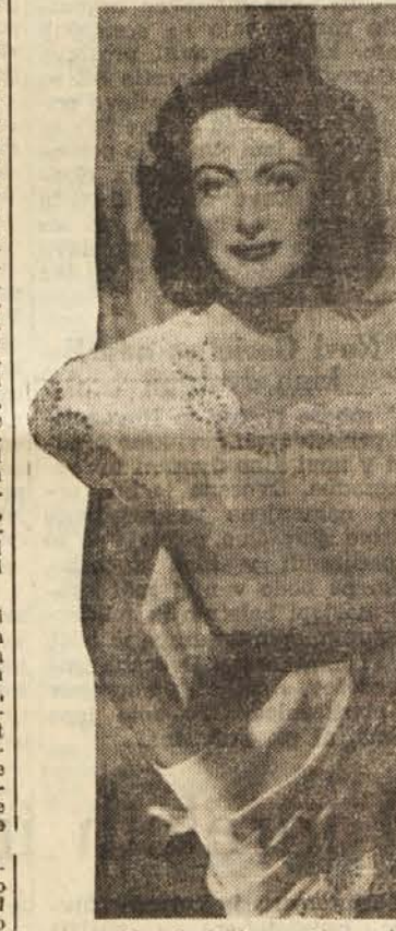
Joan Crawfordovi, znani ameriški filmski igralki, so zaupali glavno žensko vlogo v filmu »Lizbona«, ki ga snema filmsko podjetje »Paramount«. Dejanje se odigrava v glavnem mestu Portugalske.