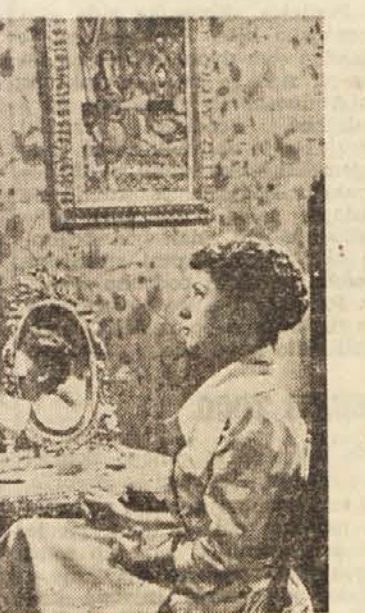
Prizor iz filma »Operacija Cicero«

Podjetje »Lovćen-film« so torej uveljavili kot dela, ki sodijo med najboljše dokumentarne filme jugoslovanske filmske proizvodnje. Nekateri ljudje pojasnjujejo to s posebno srečo, da se je pisec scenarija in režiserju posrečilo najti primerne patriotične teme. Stvar pa ni v temi. Prej bi rekli, da so te nove teme našli ljudi, ustvarjalce, dobro igralno ekipo, ki jih zna umetniško obdelati. Za vsakršni vrteljni zaporniki je značilno, da niso občutljivi za resničnosti zgodovinskih dogodkov, za informativnim napovedovalskim besedilom, ki spremlja ustrezno glasbo. Dejali bi, da gre tu tudi za nov način obdelave dokumentarnih filmov, v naši filmski umetnosti, posebej nov Besedi, glasba in filmska fotografija so celota z globokim idejnim smislom in življenjsko dramati-