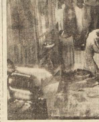
Iz filma »Ankini časi«

Kmalu bodo končana pogajanja z italijanskim filmskim podjetjem »Cine Omnia« iz Rima o snemanju skupnega filma, ki bi obravnaval neko temo iz jugoslovanske književnosti. Koliko bo to začetek za upostavljanje filmske baze in važnega filmskega središča na Jadranu, bo pokazal nadaljnji razvoj »Lovćen-filma«. Njegove perspektive lahko najbolje vidimo in presodimo na podlagi doseženih uspehov. Če bo podjetje došlo do denar, da bo izdelalo našete filme, če bo tema opravila na filmsko platno, je verjetno, da o perspektivah »Lovćen-filma« ne bo treba mnogo razpravljati. Drži, da je Črnogorsko Primorje s Hercegovinim edinstveno področje za mnoga filmska snemanja, kjer ni potreba mnogo ateljejev. Če bi v prihodnje težili za upostavljanje filmskega središča na Jadranu, bi bila to stvar širše in splošnejše razprave, potemtakem pa tudi finančne pomoči.