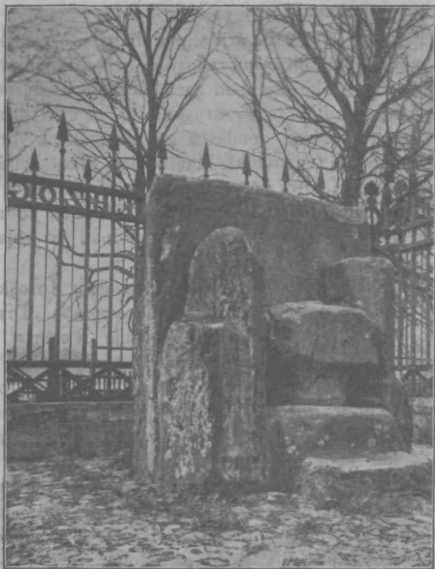
Vojvodski prestol na Gosposvetskem polju.

Na slavnem Gosposvetskem polju so podeljevali Slovenci svojemu knezu ali vojvodi vladarsko oblast. Tu pri Krnskem gradu je bivala družina, ki je imela staro pravico, da je v imenu celega naroda podeljevala vojvodi oblast, da vlada državo. To je bila kmečka družina, in gospodar te družine, ki je v imenu naroda podeljeval vladarju vojvodsko oblast, se je imenoval vojvodski kmet. Imenitni so obredi ali ceremonije, ki so se vršile, ko je novi vojvoda prevzel oblast in je bil ustoličen za vladarja. Podelitev in sprejem vladarske oblasti in s tem združene obrede imenujemo ustoličenje.