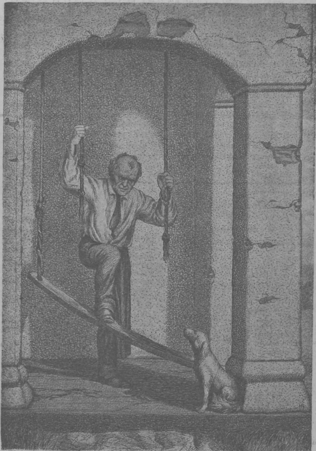
Malo z rokami, malo z nogami.