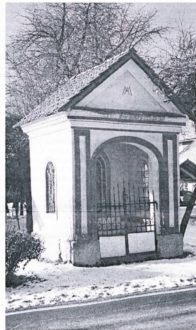
Slanova / Habjanova kapelica

Prav sredi Hotedršice, nasproti Lebanovi domačiji, stoji ob cesti, ki pelje proti Idriji, kar mogočna kapelica. Ljudje jo različno poimenujejo: eni ji pravijo Slanova oziroma Pr' Slan, drugi Habjanova ali Pr' Habjan. Obojno ime se je prepletalo zato, ker je kapelica sezidana tako rekoč na mejniku, ki razločuje posest sosedov Slanovih - Trpinovih in Habjanovih - Petkovškovih. Na vsak način gre za domačijsko kapelico. O njeni postavitvi se slišita dve zgodbi: po pripovedi Habjanovih naj bi kapelico 1905. leta postavili skupaj oboji sosedje, in naj bi stala na posesti obeh sosedov. Po pripovedi Slanovih pa naj bi kapelico postavil omenjenega leta Franc Trpin (stari ata sedanjega gospodarja Maksimiljana) v zahvalo Bogu, ki da je po priprošnji Device Marije izkazal milost njegovi sestri Urški, da se je zaobljubila nunam. Urška je tudi kupila kip Marijinega Brezmadežnega spočetja, ki ji je kapelica posvečena. - Sprva je kapelica stala ob hruški, v katero je pogosto treskalo. Zato naj bi Habjan predlagal sosedu Slanu, da bi kapelico premaknila do "tirmana" Habjanovih. Pri predstavitvi naj bi Habjanovi tudi oskrbeli ostrejšje za kapelico in bi naj poslej veljalo, da je kapelica od obojih sosedov.