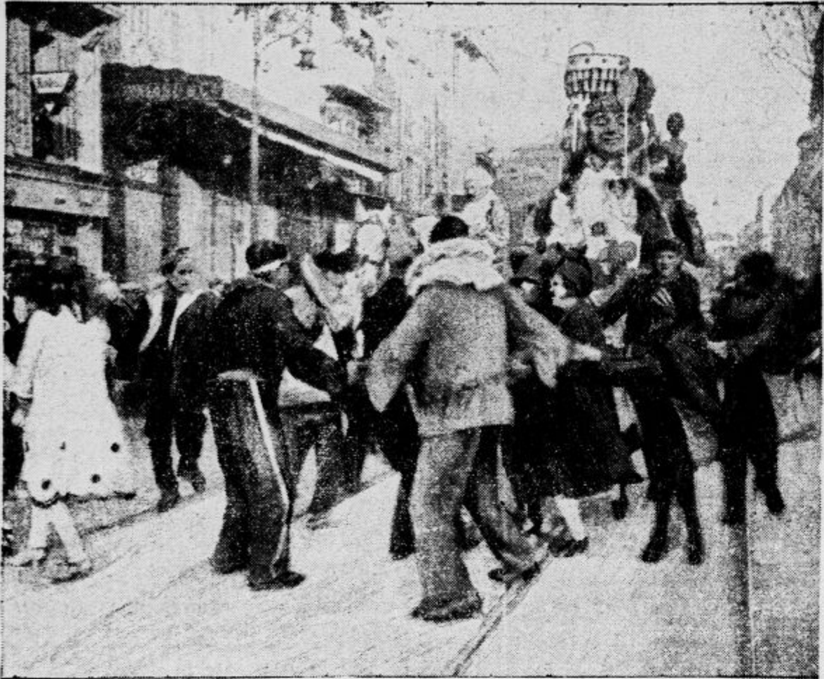
Karneval na francoski Rivijeri

Prizor iz vsakoletnih pustnih svečanosti v letoviškem mestu Cannesu.