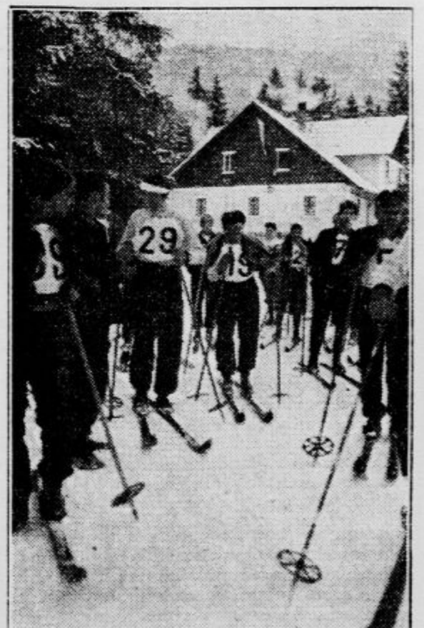
Tekmovalci za smučarsko tekmo na 30 km v Bohinju pred startom pri hotelu Sv. Janez