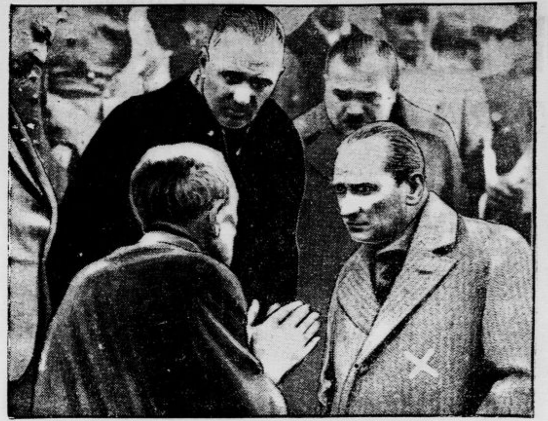
Kemal potuje po svoji državi

Ali ste že naročeni na »ŽIVLJENJE IN SVET«?