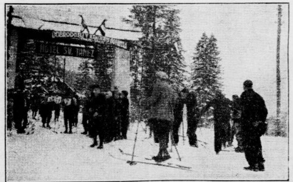
Sodniški zbor na cilju ob vhodu v hotel Sv. Janez. Zadnji vozač je privozil semkaj točno ob 12. uri.