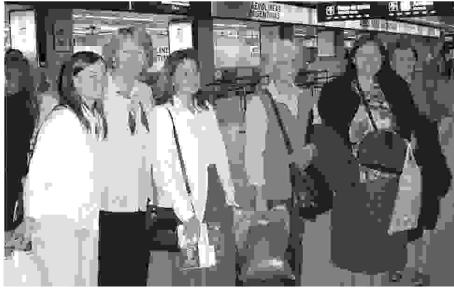
Na letališče Ezeiza pred odhodom