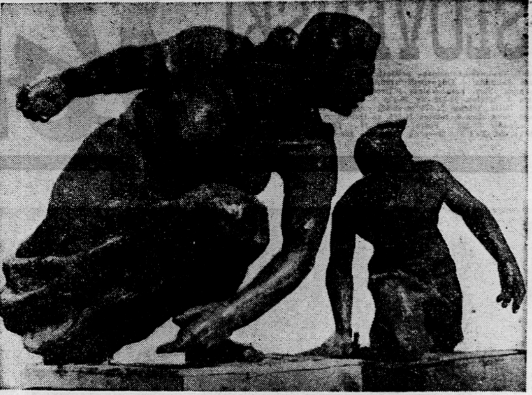
V ltvarni Umetniške zadruga so že izgotovljeni odlični za koč vski spomenik borcem. — Na sliki »Bombašica« Staneta Keržiča in »Strelec« Marjana Keršiča

Prepričani smo, da bo zato vsak državljan, zlasti pa vsak član Socialistične zveze, ter vsako podjetje, zadruga, ustanova itd. po svojih zmožnostih in zavesti podprli volilni sklad ter s tem omogočili neomejeno aktivnost organizacij Socialistične zveze.