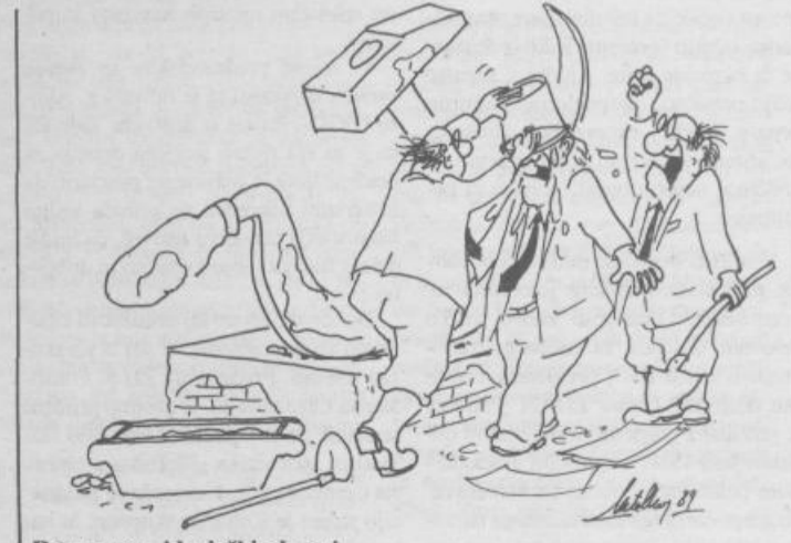
Razprava o ideološki obnovi