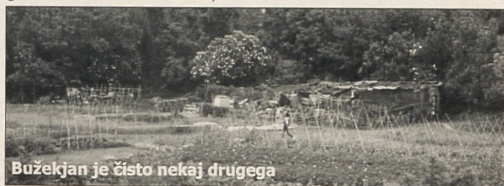
Bužekjan je čisto nekaj drugega

Občinski svetniki bodo danes v drugem branju sprejemali Odlok o občinskem pristanišču in spremembe splošnih pogojev za vzdrževanje reda v pristanišču, s katerim bodo določili, da imajo pravico do občinskega priveza le tisti izolski občani, ki imajo plovilo v svoji 100% lasti. Več razprave pa bo glede popustov za tiste lastnike, ki imajo svoja plovila privezana v mandraču. Po predlogu naj bi lastniki tradicionalnih plovil, ki jih ni prav veliko, plačali vsega 20% standardne cene, lastniki starih a ne tradicionalnih plovil pa 50% običajne cene v občinskem pristanišču. Na ta predlog imajo veliko pripomb predvsem lastniki tistih plovil, ki imajo priveze na plavajočih pomolih. Prepričani so, da bodo razliko zaradi tega popusta plačevali prav oni, kar se jim zdi povsem nekorektno s strani upravljalca.