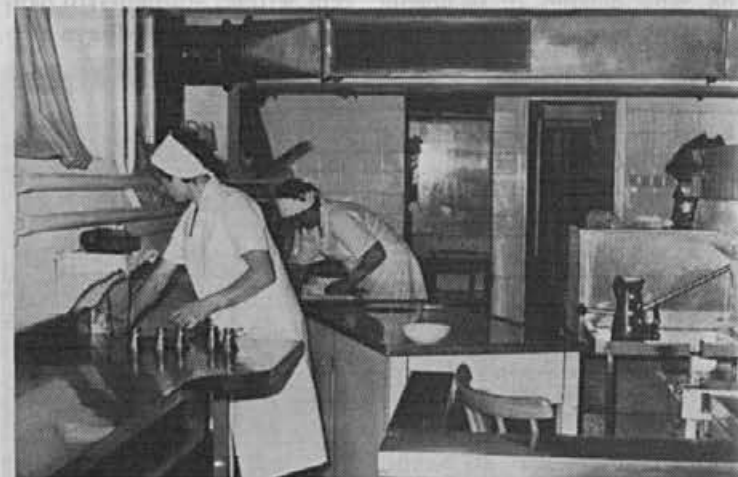
Opremo je treba sproti čistiti