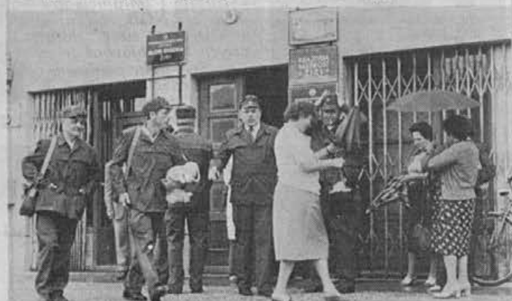
Enote civilne zaščite pred odhodom v akcijo

Zaključna akcija NNNP je tako res le zaključek dolgotrajnih priprav in usposabljanja. Oglejmo si nekaj prizorov s te vaje.