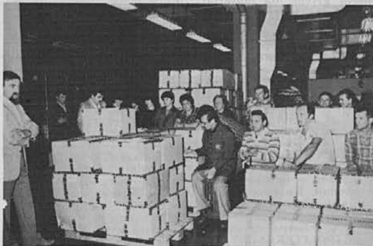
Z zbora delavcev v plastiki

Naneslo pa je, da so se dogodki odvijali hitreje, kot smo načrtovali, zato tokrat objavljamo skrajšani zapis z zbora delavcev v TOZD Plastika in delavskega sveta TOZD Plastika.