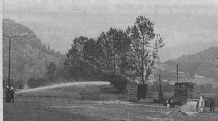
Gasilci so posredovali v industrijski coni