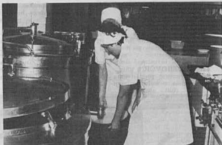
Vso vodo moramo znositi – pravijo kuharice