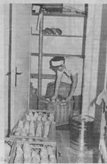
Tudi shrambe so premajhne

Za samo hrano pa lahko rečem še tole: sto ljudi, sto oku-