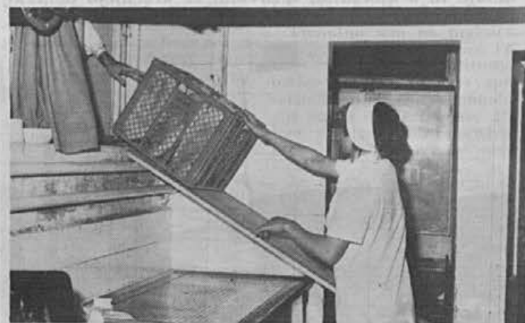
Prihaja nova pošiljka kruha