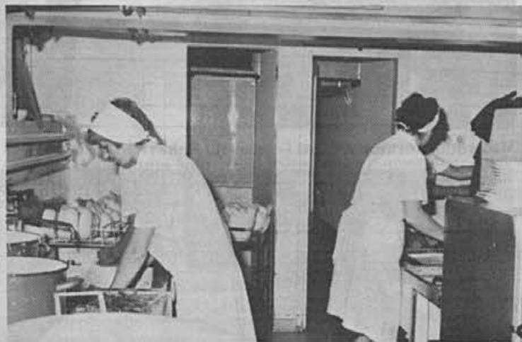
Delo v kuhinji delijo kolikor je mogoče

Že tako je problem, če me mož pripelje iz Žirovskega vrha ob treh zjutraj, se pelje nazaj in potem gre zopet sam v službo. To so stroški.