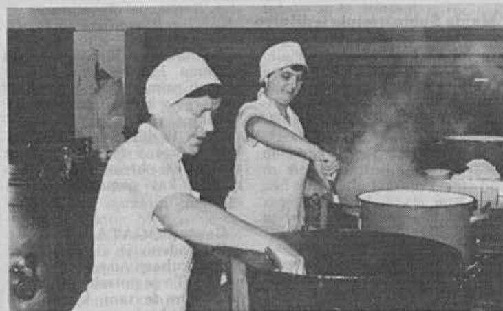
Vročina se giblje od 30 do 35 stopinj Celzija

Mogoče bi še povedala, da v dopoldanskem času pripravimo blizu 700 obrokov malic, popoldne je tega precej manj. Kot zanimivost naj povem, da dnevno porabimo 150 kg kruha, 250–300 kg krompirja, če je pečenka ali kaj podobnega – okrog 200 kg mesa, 90–100 kg solate, če je rižota – 70 kg riža in tako naprej. Samo krompirja porabimo letno preko 20 ton.