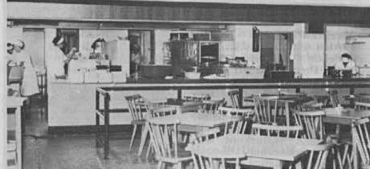
Ali pomislimo, kaj teži sodelavce za kuhinjskim pultom?