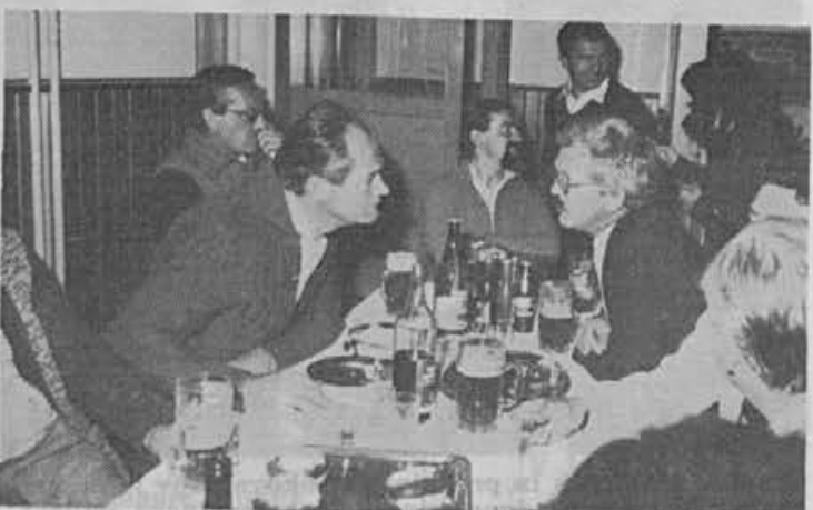
Ob koncu še sproščen pogovor z reprezentanti in kupci