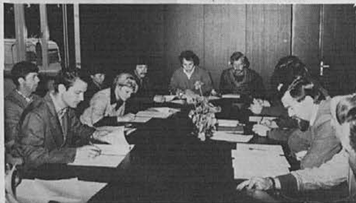
Delavski svet TOZD Plastika – o ukinitvi PU proizvodnje

Na zboru delavcev, kakor tudi na delavskem svetu je bilo še posebej večkrat opozorjeno, da bo v slučaju prerazporeditve, ob prenehanju poliuretanske proizvodnje, treba poskrbeti tudi za primerno uporabo in ravnanje s strojno opremo, ki je še vedno dragocena.