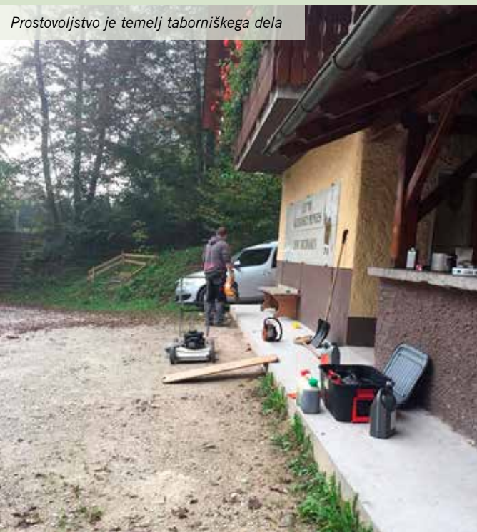
Prostovoljstvo je temelj taborniškega dela