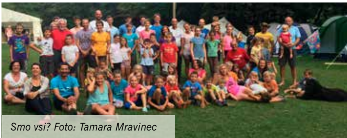
Smo vsi?

Letošnji tabor smo planinci postavili nedaleč od našega kraja, tam nad Žirovnico, v dolini Završnice ob akumulacijskem jezeru. Velik prostor z »all-inclusive« storitvami bi lahko rekli, saj niso manjkala igrišča, ogromen šotor, wc-ji »dixi« in čudovita okolica z odličnim izborom za naše skoraj vsakdanje ture. Delitev v skupine – najštevilnejši so kot vsako leto stopali po srednjih turah in osvojili Stol, Roblekov dom, Zelenico, najmlajši s starši pa so se potikali po arheološkem najdišču Ajdna, planinah pod Stolom, do Sv. Lovrenca, medtem ko so drugi kondicijsko bolj razpoloženi odšli na Brezniške peči, Begunjščico in še drugod.