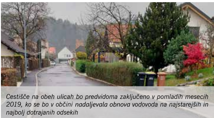
Cestišče na obeh ulicah bo predvidoma zaključeno v pomladih mesecih 2019, ko se bo v občini nadaljevala obnova vodovoda na najstarejših in najbolj dotrajanih odsekih