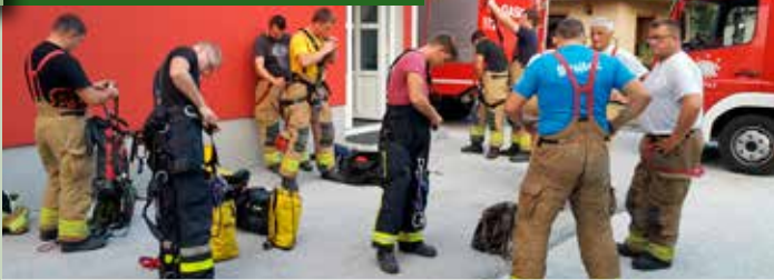
Vaje vrhne tehnike Gasilske zveze Mengeš v Loki pri Mengšu