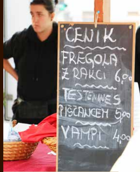
In vse po sprejemljivih cenah