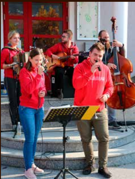
Dobra družba, hrana in glasba ansambla Odziv