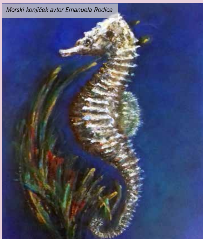
Morski konjiček avtor Emanuela Rodica