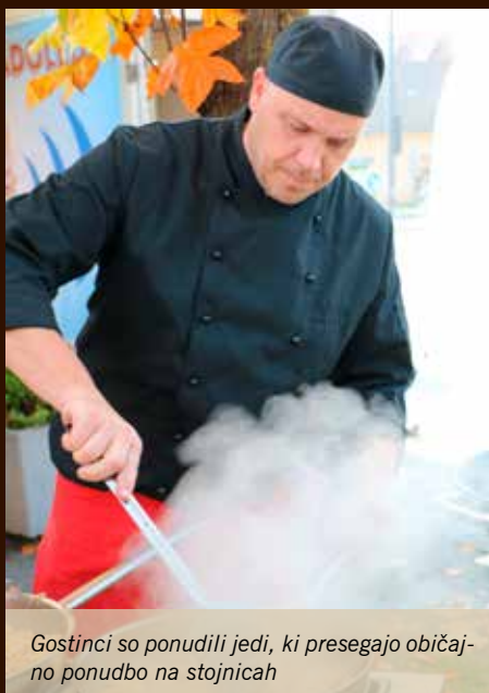
Gostinci so ponudili jedi, ki presegajo običajno ponudbo na stojnicah

Pred letom dni je prvič zazvenelo in zadišalo iz lonca mengeške kulinarčne zgodbe. Melodije okusov in glasbe so letos obiskovalce privabile in razvajale še aprila in junija ter izzvenele v soboto, 20. oktobra.