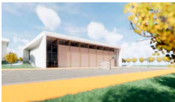
Dodatna sredstva za gradnjo bo občina pridobila na razpisu Eko sklada, saj je v projekt vključila merila in pogoje razpisa za pridobitev skoraj 900.000 EUR nepovratnih sredstev

V mesecu oktobru je občina dobila povrnjen še zadnji del založenih sredstev, in sicer 1.261.324,34 EUR, ki se bodo namenila za gradnjo nizkoenergijske Športne dvorane Mengeš.