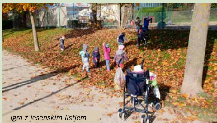
Igra z jesenskimi listjem

Besedilo: Melita Podgoršek