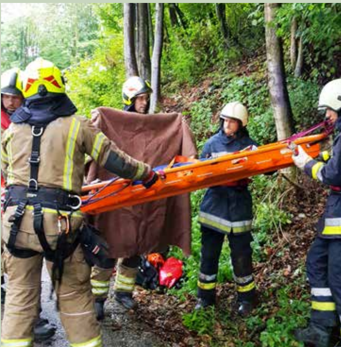
Sodelovanje operativne enote na medobčinski gasilski vaji v Trzinu

Prostovoljno gasilsko društvo Loka pri Mengšu je bilo v obdobju od julija do oktobra zelo aktivno na različnih področjih svoje dejavnosti.