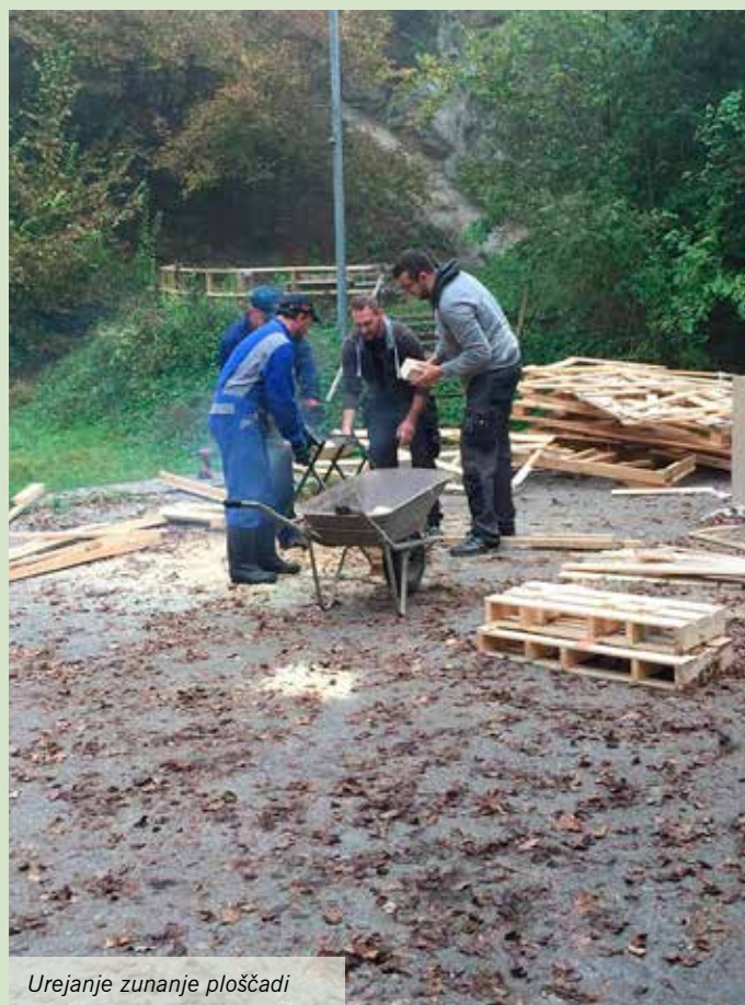
Urejanje zunanje ploščadi