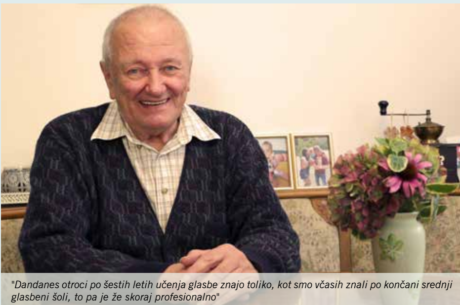
"Dandanes otroci po šestih letih učenja glasbe znajo toliko, kot smo včasih znali po končani srednji glasbeni šoli, to pa je že skoraj profesionalno"

Zagotovo veselje do glasbe in vedno se je dogajalo kaj novega. Nikoli nista bila dva