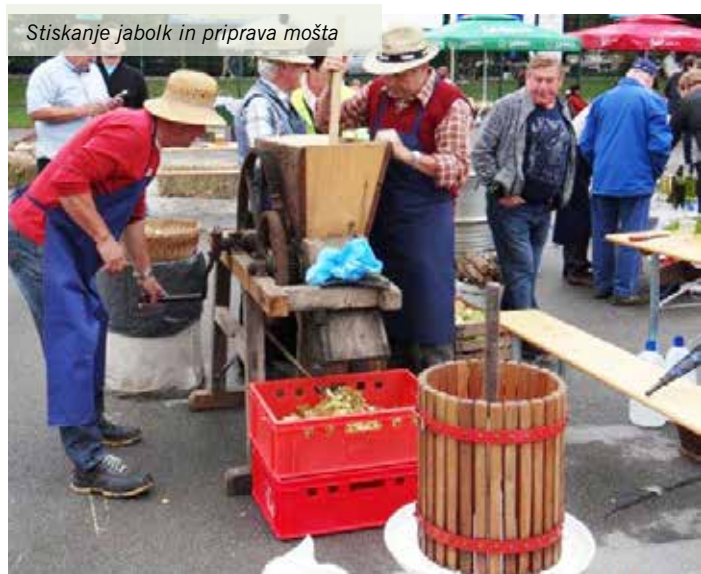
Stiskanje jabolk in priprava mošta

Besedilo in foto: Matjaž Repnik, Kulturno društvo Mihaelov sejem in Toma prireditve