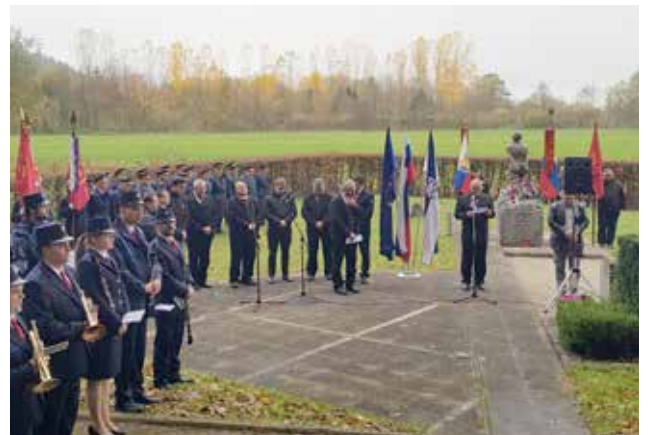
V Mengšu je bila žalna slovesnost pri spomeniku talcem na Zalokah