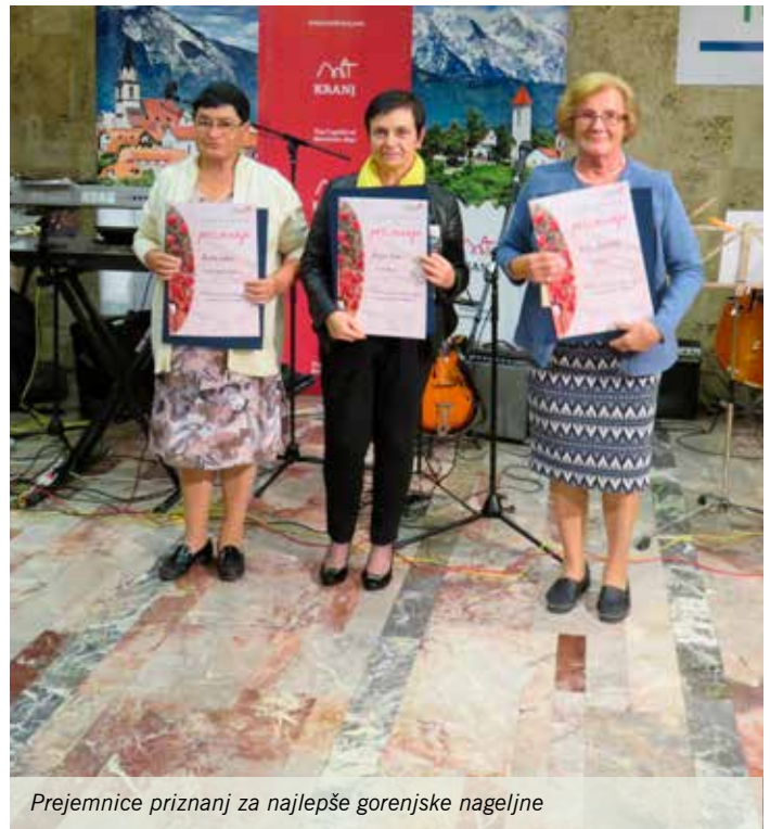
Prejemnice priznanj za najlepše gorenjske nageljne