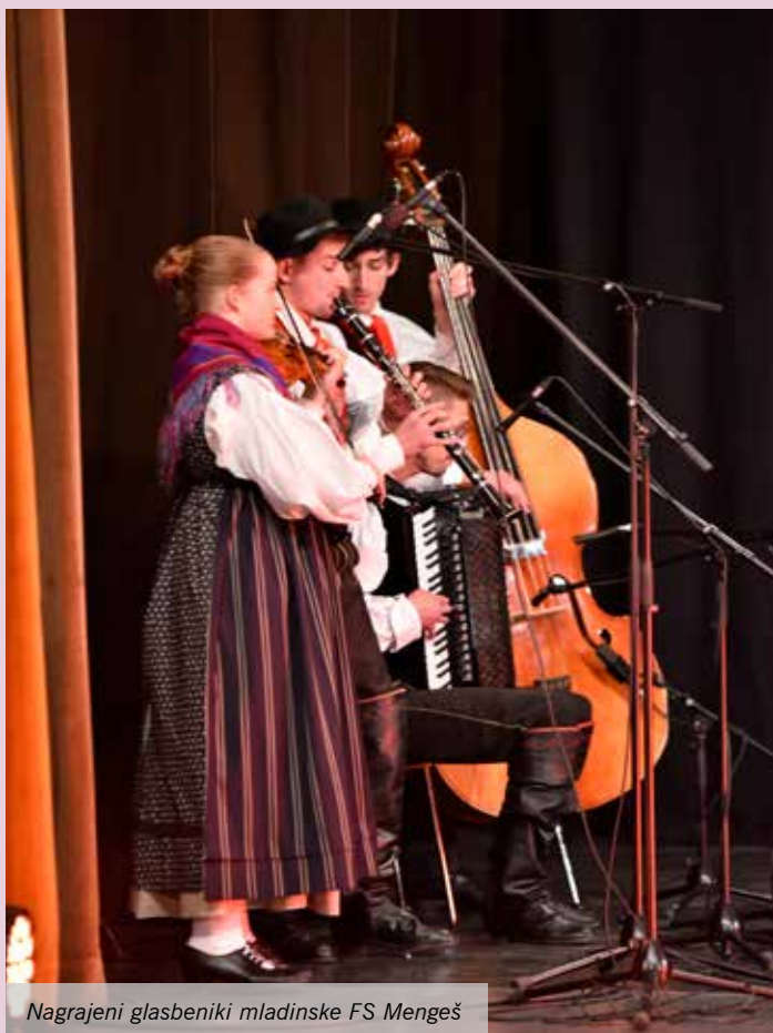
Nagrajeni glasbeniki mladinske FS Mengeš