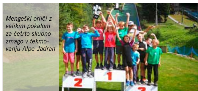
Mengeški orlički z velikim pokalom za četrto skupno zmago v tekmovanju Alpe-Jadran

Besedilo: Miha Šimnovec