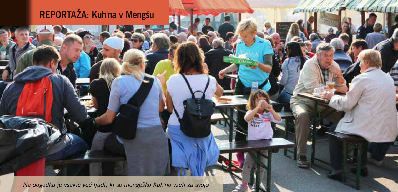
Na dogodku je vsakič več ljudi, ki so mengeško Kuh'no vzeli za svojo