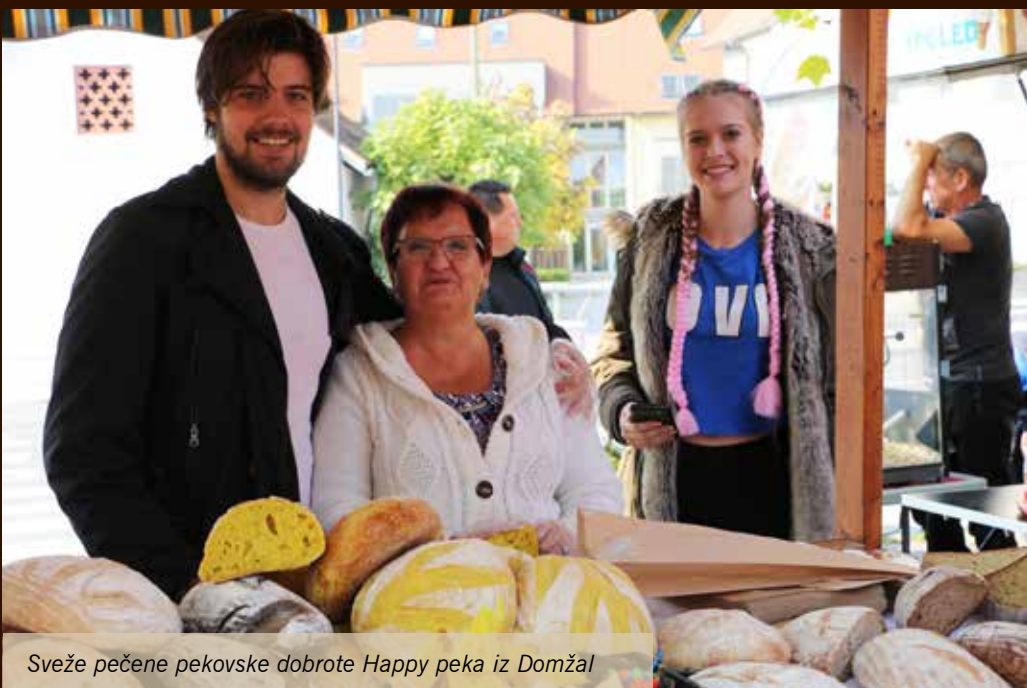
Sveže pečene pekovske dobrote Happy peka iz Domžal