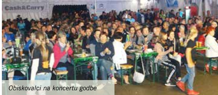
Obiskovalci na koncertu godbe