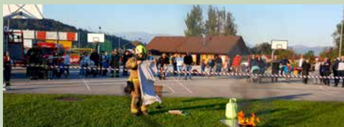
Prikaz pravilnega gašenja gorečega olja z mokro/vlažno krpo ali pokrovko