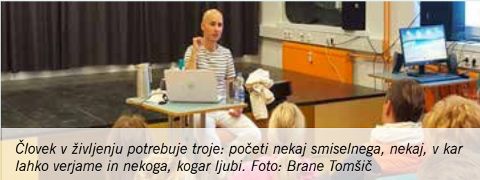
Človek v življenju potrebuje troje: početi nekaj smiselnega, nekaj, v kar lahko verjame in nekoga, kogar ljubi.

Pred leti sem prvič obiskal zdravnika ajurvedske medicine, ki je na osnovi nekajminutnega pregleda natančno vedel, kakšno je moje zdravstveno stanje, kdo sem, kako razmišljam, kaj vse in kdaj sem dal skozi v življenju ... Nisem razumel, kako lahko vse to ve, ne da bi videl mojo zdravstveno kartoteko ali krvne izvide, zato sem ga vprašal: »Kako veste vse to?« Odgovoril je: »Andrej, vaše telo je le manifestacija, kristalizacija vaših misli in občutkov.«