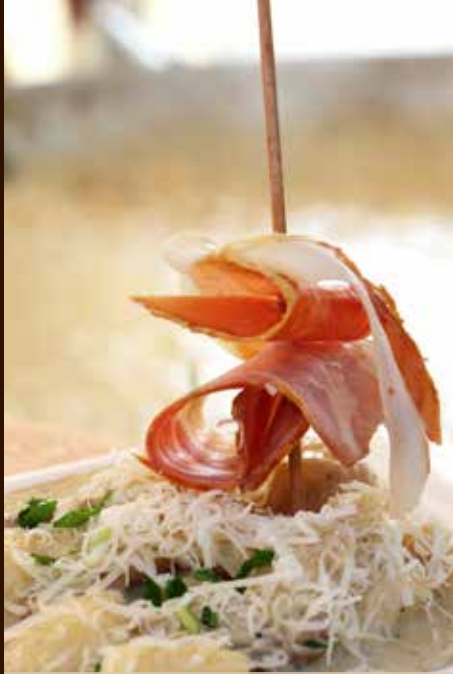
Hrana, ki je dobra tudi za oči