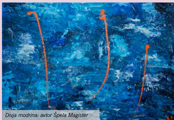
Divja modrina: avtor Špela Magister

Besedilo: Binca Lomšek