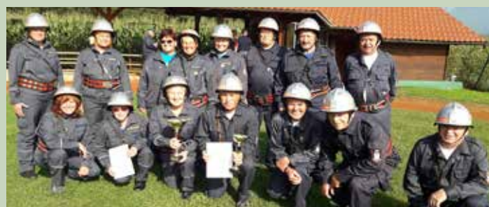
Starejše gasilke in gasilci na občinskem tekmovanju v Topolah

Besedilo: Miro Urbanc