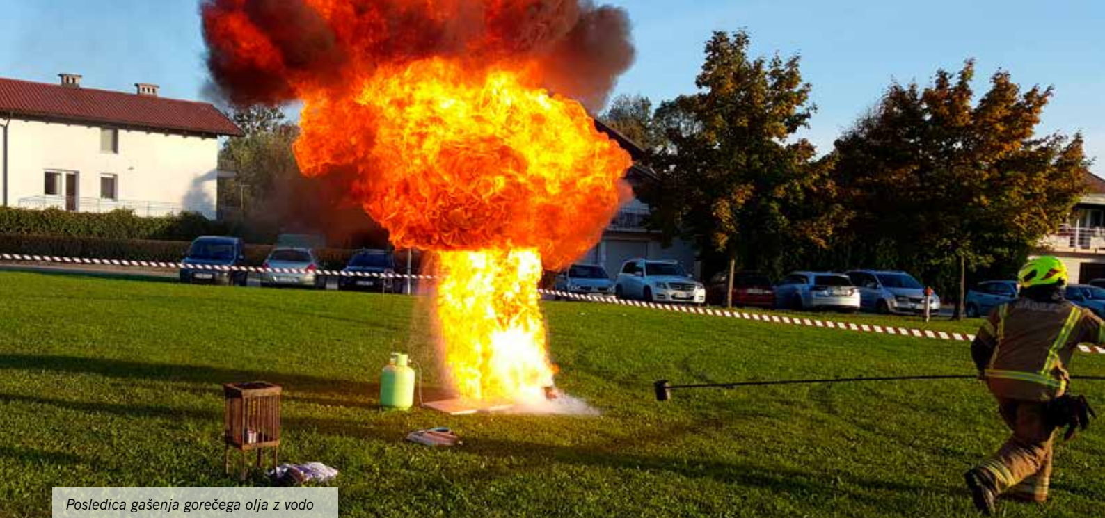
Posledica gašenja gorečega olja z vodo