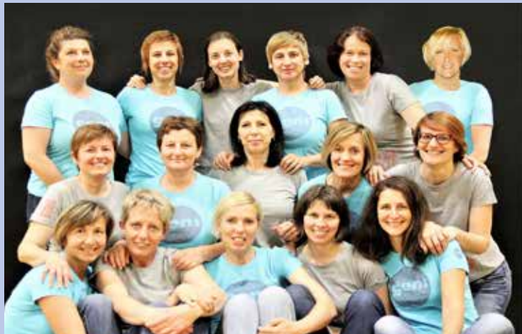
Celotna ekipa košarkaric ŠD Partizan Mengeš.

Vsako jesen se v Mengšanju oglasi ženska košarkarska sekcija ŠD Partizan. Tudi letos ni nič drugače, saj smo bile aktivne skozi celo leto. Decembra 2017 je ekipa sklenila, da se v letu 2018 udeležimo 10. FIMBA evropskega prvenstva v košarki za veterane Maribor 2018, ki je potekalo od 22. junija do 1. julija 2018. V pričakovanju prvenstva smo se prvo polovico letošnjega leta pripravljale na naš tamkajšnji nastop in se v vmesnem času udeležile tudi turnirja v Dobrovi ter imele nekaj pripravljanih prijateljskih tekem pred prvenstvom.