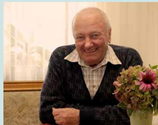
Leta 2000 je postal prvi kapelnik novoustanovljene veteranske godbe

Zaradi tovarne so v Mengeš prišli ljudje z različnim znanjem. Delali so vsa godala, tamburaške inštrumente za celo Jugoslavijo. Na koncu so delali le še harmonike in kitare. Bili pa so veliki strokovnjaki. Šolske harmonike so bile najboljše.