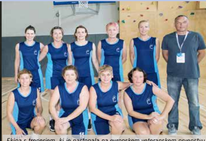
Ekipa s trenerjem, ki je nastopala na evropskem veteranskem prvenstvu (FIMBA).

Nato je nastopil čas prvenstva, ki se ga je udeležilo 132 ženskih in moških ekip iz celotne Evrope. V naši skupini (nad 40 let) je sodelovalo 10 ekip (3 Slovenija, 2 Rusija, 2 Nemčija, Italija, Ukrajina ter Madžarska). Na prvenstvu smo osvojile osmo mesto. Naša ekipa je navdušila tako sotekmovalke (predvsem dejstvo, da v naši ekipi ni nobene profesionalne igralka, ter naša borbenost), kot tudi naše družine, ki so nas ves čas prvenstva spodbujale s tribune in bile naš šesti igralec, za kar smo jim seveda iz srca hvaležne.