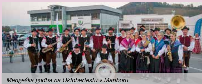
Mengeška godba na Oktoberfestu v Mariboru