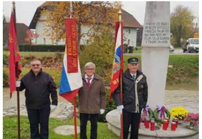
V Loki pri Mengšu je bila žalna slovesnost pri spomeniku žrtvam NOB

Žalni slovesnosti sta že tradicionalno potekali v sredo, 31. oktobra. V Loki pri Mengšu je bila žalna slovesnost pri spomeniku žrtvam NOB ob 10. uri, pri spomeniku talcem na Zalokah v Mengšu pa ob 11. uri.