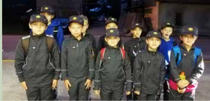
Pionirji so nastopili na državnem tekmovanju v Gornji Radgoni