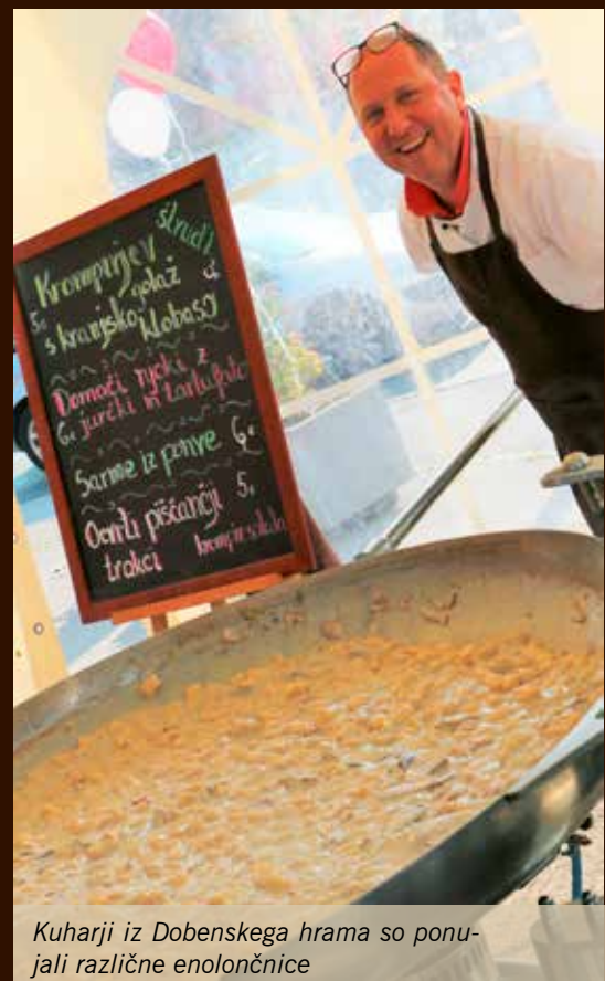
Kuharji iz Dobenskega hrama so ponujali različne enolončnice