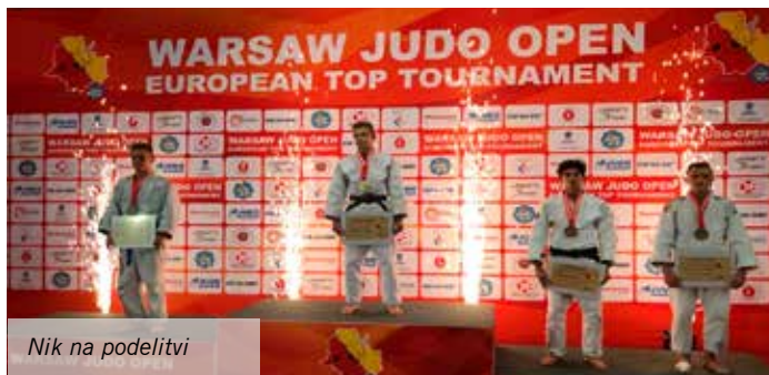
Nik na podelitvi