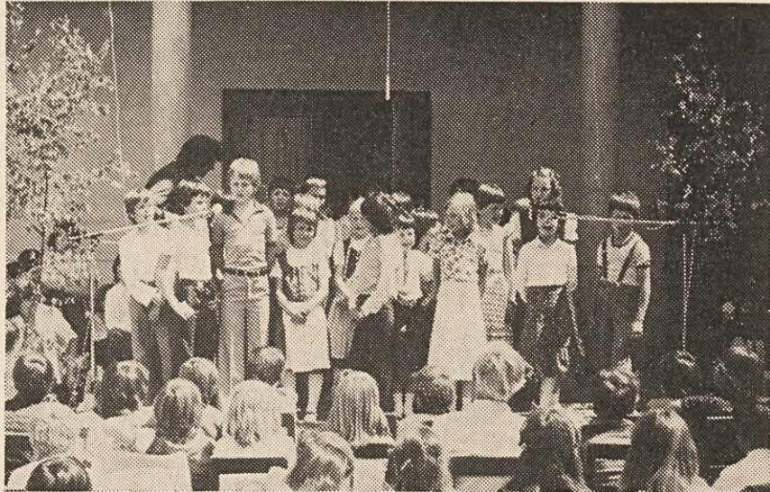
Skupina otrok iz Šmarjete v Rožu

krat. Pa je ostal le lep spomin. Kdor je bil prisoten, je lahko samo približno ocenil ves trud organizatorjev in voditeljev posameznih skupin. Le-te so tvorile dokaj harmonično celoto koroške tvornosti in talentov najmlajšega rodu slovenske in dvojezične koroške stvarnosti.