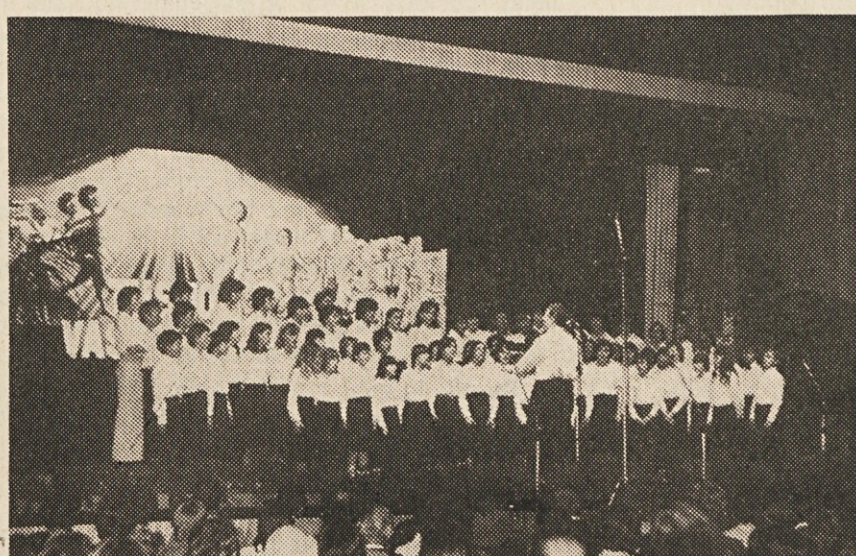
K slikama: Otroški vrtec iz Šentpetra (levo) ter mladinski zbor