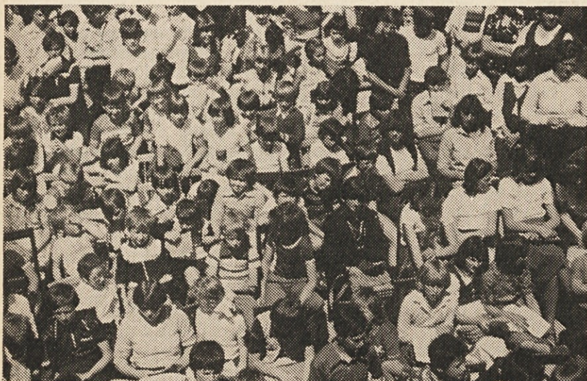
Pogled na del udeležencev otroškega dneva

Sosedje, odjemalci in bralci NT staršem iskreno čestitajo, mladi hčerki pa želijo vse najboljše za čim srečnejšo življenjsko pot.