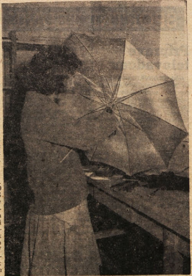
Iz servisa za popravilo dežnikov pri Stanovanjski skupnosti - Center, Trbovlje

SOBOTA, 15. februarja 18.00 Poročila (Zagreb); 18.05 »Mlin na veter« — mladinska igra; 19.00 TV obzornik (Ljubljana); 19.20 Ekspedicija (Ljubljana); 19.50 Kaj bo prihodnji teden na sporedu (Ljubljana); 20.00 TV dnevnik (JTV); 20.30 Propagandna oddaja (Ljubljana); 20.45 Ogledalo državljana Pokornega — humoristična oddaja (Beograd); 21.45 Serijski film (Ljubljana); 22.15 Poročila (Ljubljana).