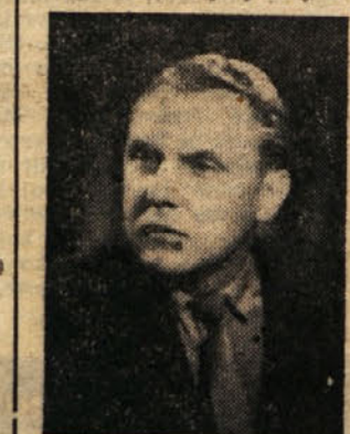
Letnega gledališkega dela posvetil tudi mladim.

in željo za sodelovanje na gledališkem ali drugem kulturnem področju. Skoda le, da je kulturna dejavnost razgibana bolj med gimnazijci, manj pa med ostalo mladino. Kljub temu pa imam tu troboveljski težave, ker gimnazijci po končanem šolanju prenehajo s kulturnim delom zaradi študija v Ljubljani. Torej se vsako leto prične del kulturnega življenja z novimi dijaki. Vendar, kot sem omenil, dobra volja in razumevanje pomenita veliko.