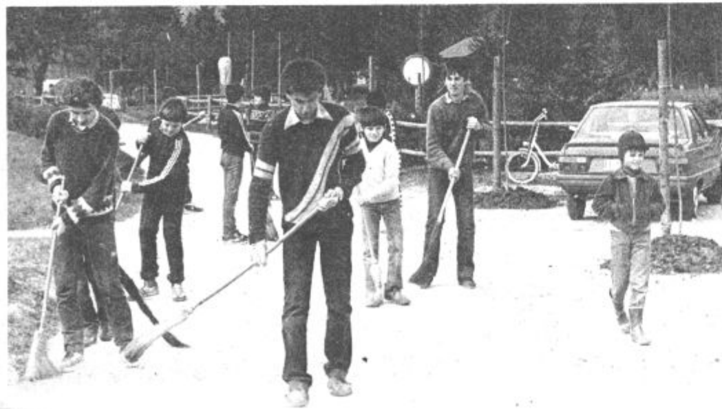
Vsak je pomagal po svojih močeh, najmlajši so se takole vključili v delo