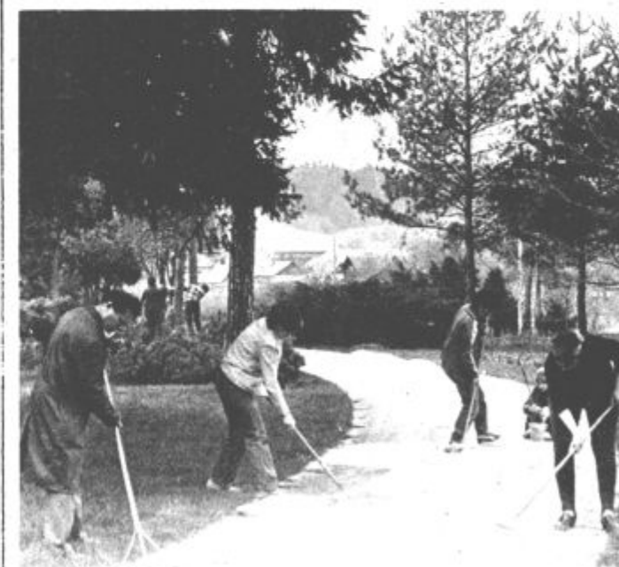
Na sobotni prostovoljni delovni akciji so med drugim uredili tudi poti v gaju