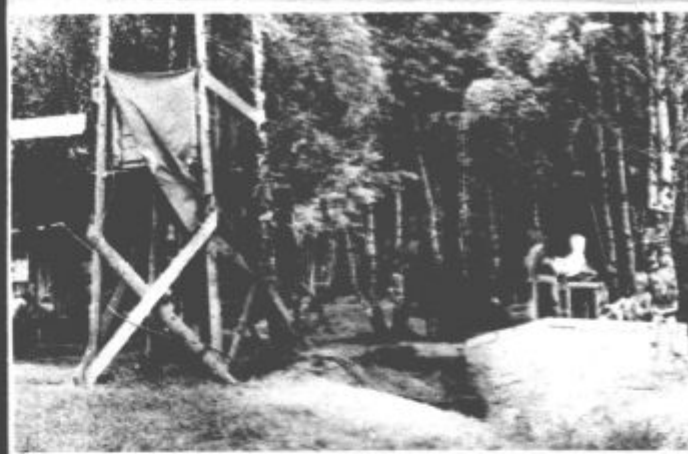
Dnevno taborjenje v Zavodnjah je prijetna in poceni oblika letovanja otrok

Dnevni prispevek za tabor bo 100 dinarjev iz skupnih sredstev pa bo občinska zveza prijateljev mladine v ta namen prispevala še približno 40 odstotkov za režijske stroške. Tudi za tabor v Zavodnjah lahko starši prijaviijo otroke pri poverjenikih za letovanje na šolah in sicer za pet ali deset dni. S tem zagotovijo mesto. Občasni obiskovalci pa naj bi v taboru prinašali denar s seboj.