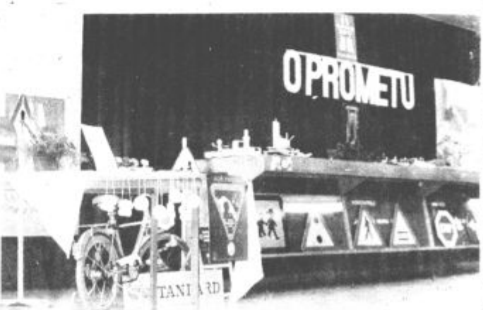
Veliko pozornost je pritegnila tudi razstava o prometu