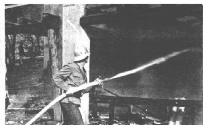
Vso skrb požarni varnosti