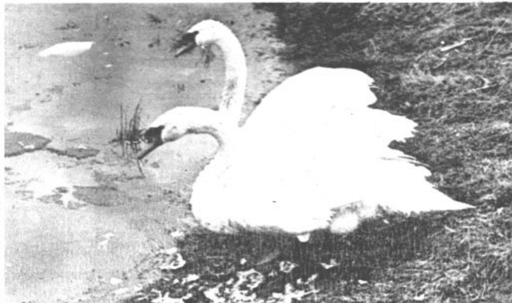
Dobra fotografija, veliko zadovoljstva

Morebitne predloge, kritike in opozorila v zvezi s slovenščino v javni rabi pošiljajte na naslov: JEZIKOVNO RAZSODIŠČE, Republiška konferenca SZDL Slovenije, Ljubljana, Komenskega 7.