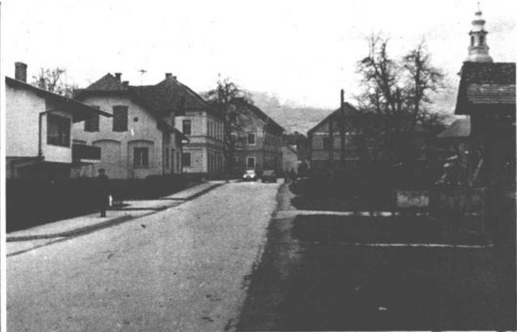
Pred vsemi kraji Šmartnega ob Paki je letos ogromno dela

makniti za to malo več denarja. S skupnimi močmi bodo gotovo kos tej zahtevni in odgovorni nalogi.“