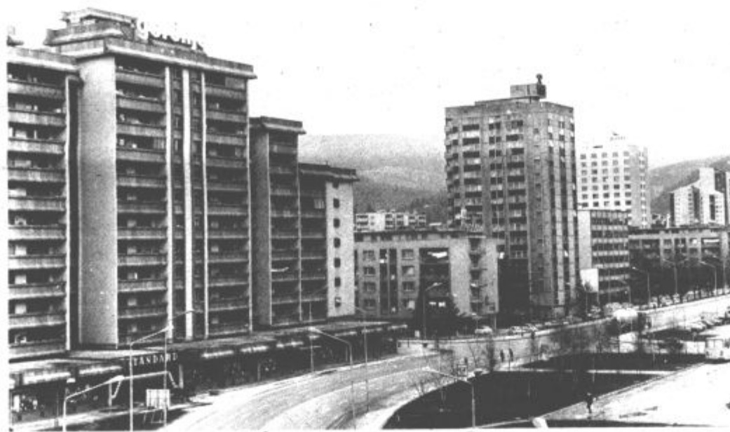
Letos bodo v KS Center levi breg ustanovili 26 skupnosti stanovalcev

Posebno pozornost bodo letos namenili akciji ustanavljanja skupnosti stanovalcev. Ponekod bo skupnost zajemala eno stanovanjsko hišo, drugod pa več, odvisno od števila prebivalcev in potreb. Tako načrtujejo ustanovitev 26 skupnosti stanovalcev. Vse načrtovane naloge bodo zanesljivo uspešneje reševali, ko bodo za štiri ure zaposlili tajnika krajevne skupnosti, kar se bo zgodilo prav kmalu. B. Mugerle