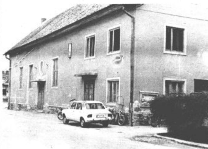
Le s skupnimi močmi bodo lahko obnovili kulturni dom, ki svojemu namenu že dolgo ne služi več.

Tem že sedaj namenjajo precej pozornosti. Težave bodo skoraj zagotovo nastale tudi pri kasnejšem vzdrževanju. Krajevna skupnost bo morala vsako leto pri-