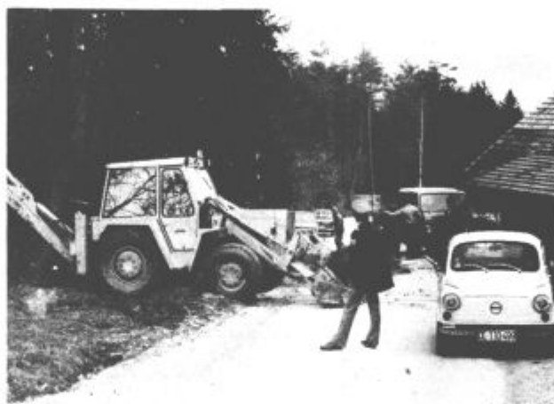
Zasutje gradbene jame