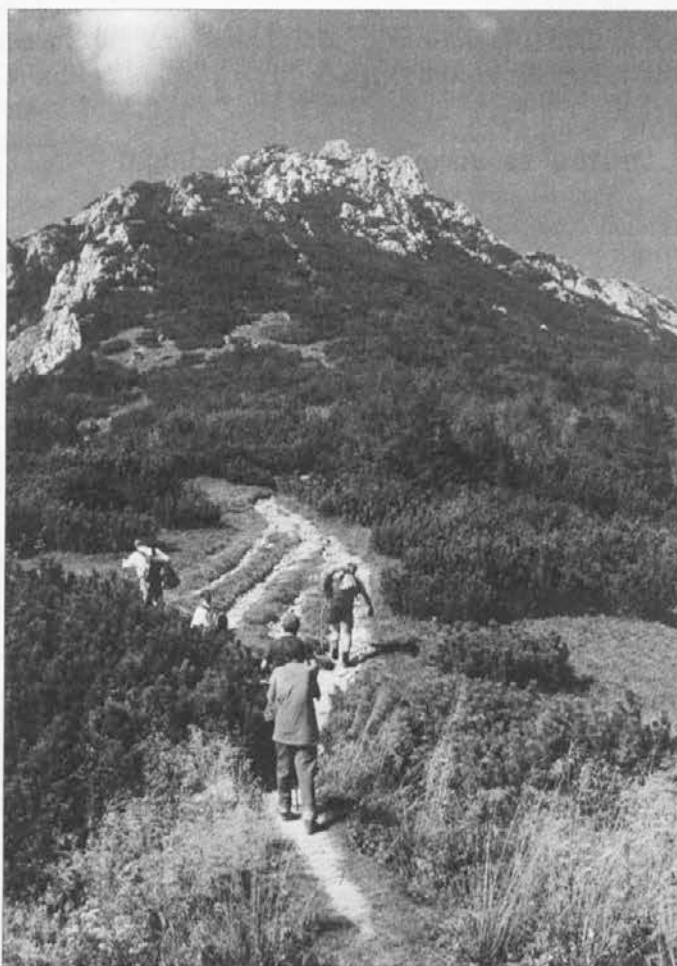
Telesna aktivnost krepi telo in izboljšuje počutje.

Vir: revija Zdravje BVD – Ravne, d. o. o. Milena Forstner