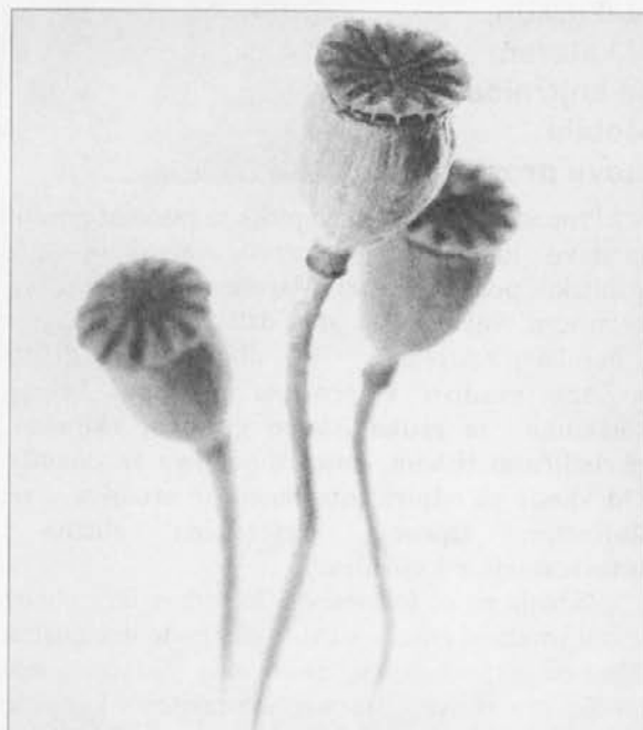
Fotografija iz cikla Skeleti avtorja Toma Jeseničnika