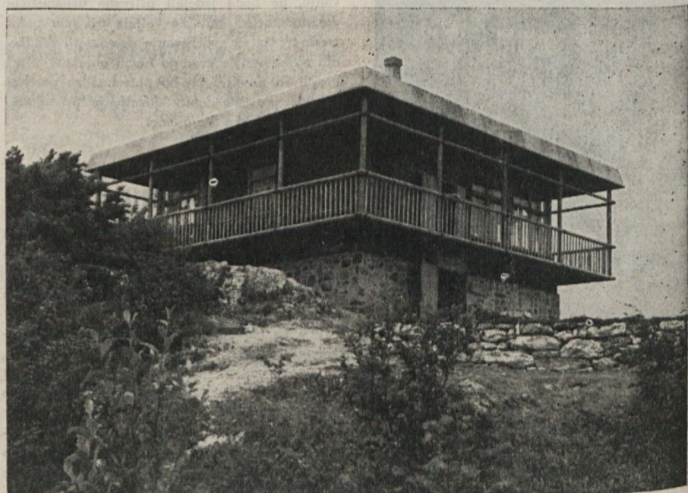
Na vrhu Krima

• Nočna akcija je zelo zgovorna. Nočni vra- tarji „na mestu“ so bili v manjšini. Tu in • tam bi sicer lahko navedli olajševalne oko- liščine za pomanjkljivosti (če olajševalne • okoliščine sploh lahko priznavamo, kadar • gre za varnost podjetja in za njihove mili- jonske vrednosti). Kaže, da bi vodstva de- lovnih kolektivov morala malce več raz- mišljati o tem, če so storila vse, da bi se • učinkovitost nočne službe izboljšala. Spo- mnimo naj vas samo na en značilen pri- mer: aparati za gašenje na stenah sami po • sebi še niso nobena varnost pred požarom. • In naj vam ob koncu povemo še vse tiste, • ki so sodelovali na naši nočni akciji: ko- • mandir PLM Vič, uslužbenci oddelka za • notranje zadeve občinske skupščine Vič- • Rudnik in sodelavci našega lista.