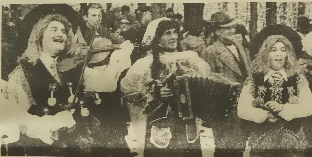
ČIČARA BANDA Z BOROVEGA GOSTUWANJA V BODONCIH — Za malo denarja malo muzike in obratno, ni le pregovor, ampak izhodišni pristop do veseljačenja, v kakršnega se vse bolj spreminja tradicionalna poroka z borom. Še vedno pa ostaja paša za oči številnih obiskovalcev, ki se v času predpusnih norčij radi odpravijo na prizorišče borovega gostuwanja, kjer je poleg našemljenih mask tudi dovolj jedače in pijače. Zapis z letošnjega borovega gostuwanja v Bodoncih si lahko preberete na strani 5.