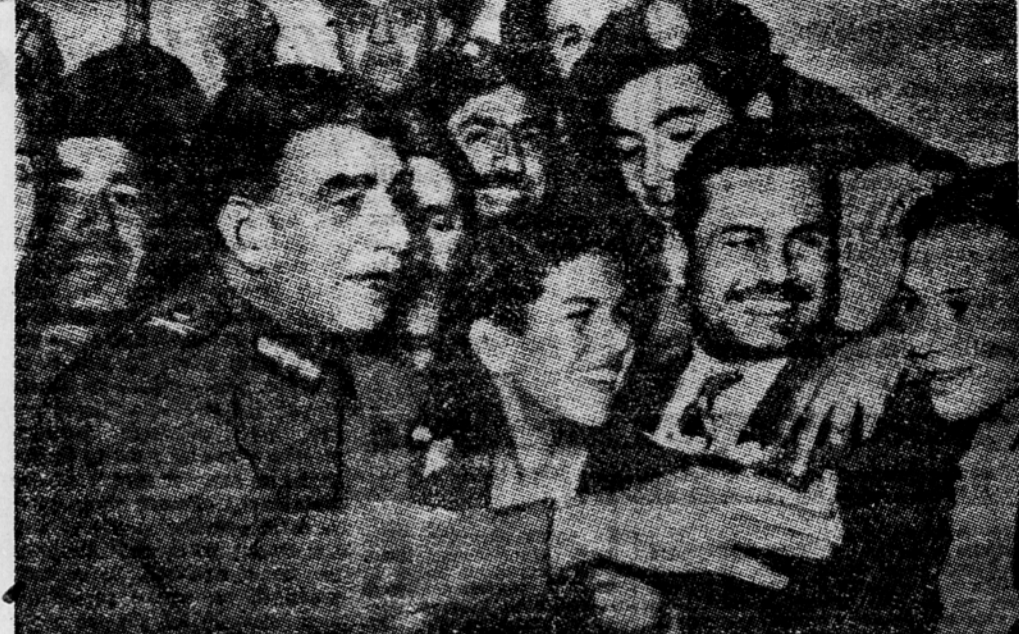
Na sliki vidimo generala Nagiba, ki je ponovno prevzel dolžnosti predsednika republike. Vendar pa s tem položaj še ni popolnoma jasev. Kot znano, se je pred nekaj dnevi moral zaradi burnih demonstracij vrniti iz Kartuma, kamor pa namerava ponovno odpotovati, ko bo otvoritev sudanskega parlamenta. Vendar se govoriče, da obstajajo med njim in polkovnikom Naserjem še vedno nesoglasja nečelo položaj. Vsekakor je treba še nekaj časa počakati, da bi se videlo ali je njegov položaj res tako trden kot bi to skušali nekateri dokazati.