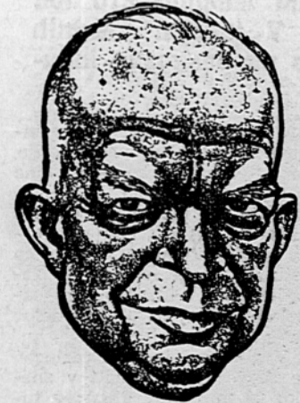
D. Eisenhower svoje stališče. Ko je omenil svoje izkušnje iz armade, je Eisenhower dejal, da je večkrat dajal izjave pred odbori, da pa je bilo vedno v ozračju medsebojnega spoštovanja. Takoj nato je Eisenhower zavrnil obtožbe senatorja Mc Carthyja, da armada sliši komuniste ter je izjavil, da predsednik ZDA nosi končno odgovornost za vodstvo v državni upravi. V svoji izjavi se je predsed-

Rim, 4. marca. Tanjug. Vodstvo krščanskodemokratske stranke je sklenilo, da bo 20. marca sklicalo nacionalni svet stranke. Konferenci sveta bodo predlagali, naj se junija sestane kongres krščanskodemokratske stranke. Na kongresu naj bi razpravljali o najrazličnejših konceptih krščanskodemokratskih strui, nakar naj bi z glasovanjem prišli do enotne politične smeri, ki bi jo stranka izvajala. Glede na krepitev levih struj v podeželskih organizacijah pričakujejo, da bodo močno kritizirali sedanjo politiko stranke ali celo, da se bo spremenila uradna politična smer. Od vseh frakcij je ravno Gronchijeva levica najbolj vztrajala, da naj se kongres čimprej skliče.