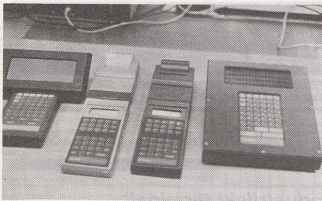
Družina industrijskih terminalov ima široke uporabne možnosti.