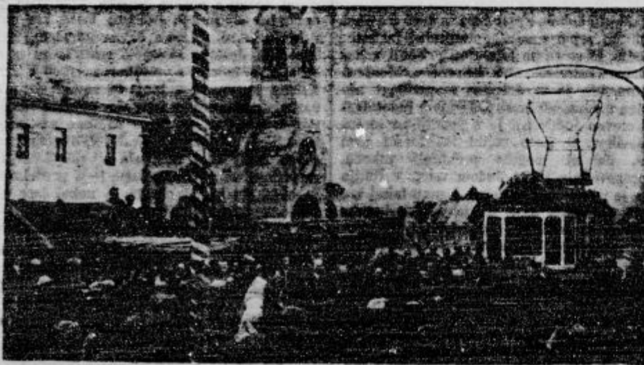
Pretekli teden je stekel prvi tramvaj do pokopališča pri sv. Križu

p Naak zgodovine je treba razumeti pra- večano. »Trgovski list« piše: Češkoslovaški centralizem je bil upravno dober, a se kljub temu ni mogel vzdržati. Še manj se more vzdržati centralizem, ki ima slab upravni na- čin, ker v tem primeru se pokažejo vse nje- gove napake v še bolj medli luči. Mi Jugoslo- vani smo v svoji zgodovini spoznali že dosti centralizmov in tudi takih, ki so bili večjih silovito močni. Toda, ko je prišel usodni tren- utek, ni mogel niti en tuji centralizem za- držati volje po združitvi našega naroda in vsa sila vseh teh centralizmov je padla. Če že ne moremo upoštevati nauka in dogodkov zad- njih dni, pa bi morali upoštevati vsaj dogod- ke iz naše lastne zgodovine! Smisel politike je zbrati narodne sile za velike cilje. Centra- lizem ne zbira sil, on samo navidezno vlada nad njimi. Kadar pa pridejo usodni trenutki, potem je tudi vse te navideznosti konec in pokaže se vsa nemoč centralizma. Ni pametno čakati, da šele usodni dogodki podajo ta do-