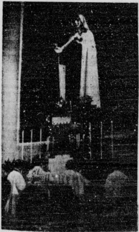
Ob veliki udeležbi vernikov od blizu in daleč je škof dr. Rožman ono nedeljo blagoslovil na Kodeljevem novo cerkev sv. Terezije Deteta Jezusa

d Duhovne vaje na Mali Loki bodo za žene od 12. do 16. novembra. Za dekleta od 26. do 30. novembra in pred božičem od 17.