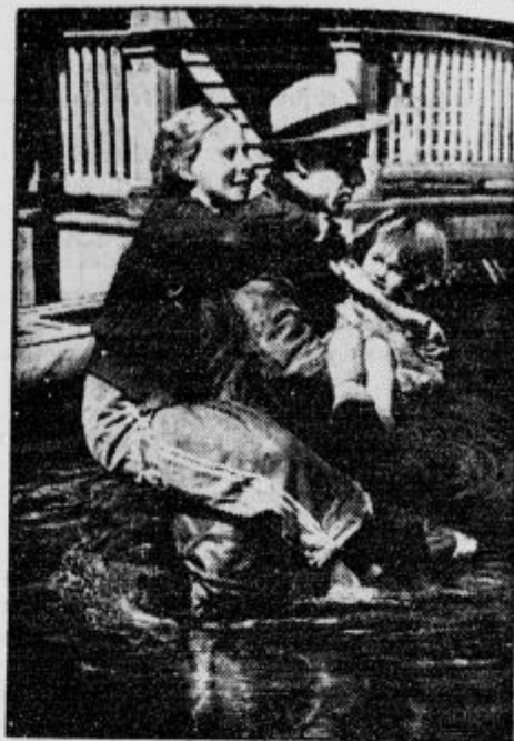
Pred kratkim so divjale v nekaterih krajih v Sev. Ameriki velike povodnji. Slika nam kaže prizor, kako mož rešuje otoka in ženo pred narasčajočo vodo.