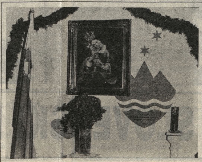
Brezjanska Marija in slovenski grb

A ko je to prišlo v javnost, se je začelo govoriti tudi o drugi kočljivi točki: država denarno podpira katoliško Cerkve, kot to tudi določa ustava. Običajno se trdi, da ima to svoj razlog, ker je svojčas država zaplenila velika cerkvena posestva. Maloštevilen denar, ki ga Cerkve prejme, je le bore zadoščenje za vse zaplenjeno premoženje. A v samem cerkvenem občestvu se slišijo vedno glasnejši glasovi, češ da ta podpora Cerkvi bolj škodi, kot pa koristi. Celotna vsota te podpore znaša letno približno sedem milijonov dolarjev in Cerkve včasih celo ne porabi vsega denarja. Vsak škof namreč dobi plačo, ki je enaka sodnijski, škofije pa za vsakega semeniščnika prejmejo vsoto enako začetni plači državnih uslužbencev. Seveda potem so še zastoj voznje, davčna oprostitev, plače župnikom v „obmejnih predelih“ in podpora semeniščem petih velikih redov. Vse to pa v škodo ugleda, ko na Cerkve padajo tožbe o privilegijih, zlasti s strani raznih sekt, ki vedno globlje prodirajo v argentinski narod. Ustavna reforma, če bo izvedena, bi morala te točke res temeljito prerešeti.