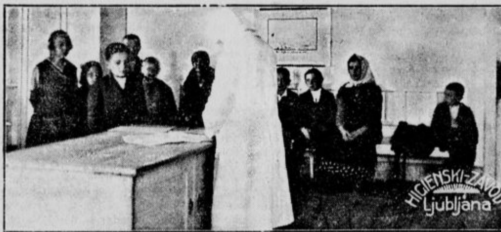
Sestra v šolski polikliniki Zdravstvenega doma v Lukovici pripravlja deco na zdravniški pregled.

Zanimivo je sledeče dejstvo: Ko se je začelo l. 1901 v Ljubljani snovati »Splošno slovensko žensko društvo«, je »Slovenka« o tem dobila iz Ljubljane pismeno obvestilo z dostavkom, da sme o tem poročati, toda pod pogojem, da izrečno dostavi, da pobuda za to organizacijo ni izšla iz njenih predalov. Tudi iz tega je razvidno, da »Slovenka« že takrat ni imela prijateljev niti v katoliškemu nasprotnem ženskem taboru. Kasneje so osebni spori v najožjem »Slovenkinem« krogu mnogo pripomogli, da se je število sotrudnikov in naročnikov zmanjšalo. Lastništvo je koncem leta 1903. list ustavilo.