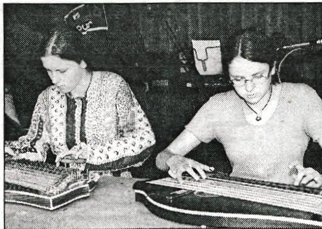
Citre so vse bolj priljubljeno glasbilo med mladimi.