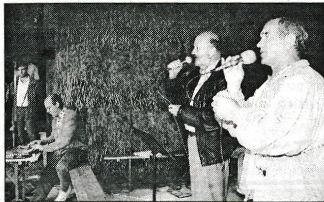
Pravijo, da nadaljujejo 100-letno tradicijo. Prišli so tudi na Ermanovec - Kamniški koledniki seveda.

nični harmoniki že pravi mojster in bodo morali z njim resno računati tudi vsi tekmovalci na 6. gorenjskem prvenstvu harmonikarjev v