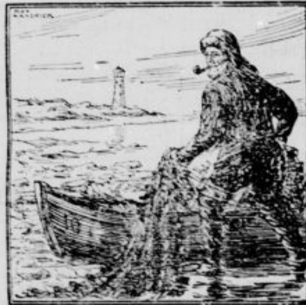
Kje je mornar Kleč?