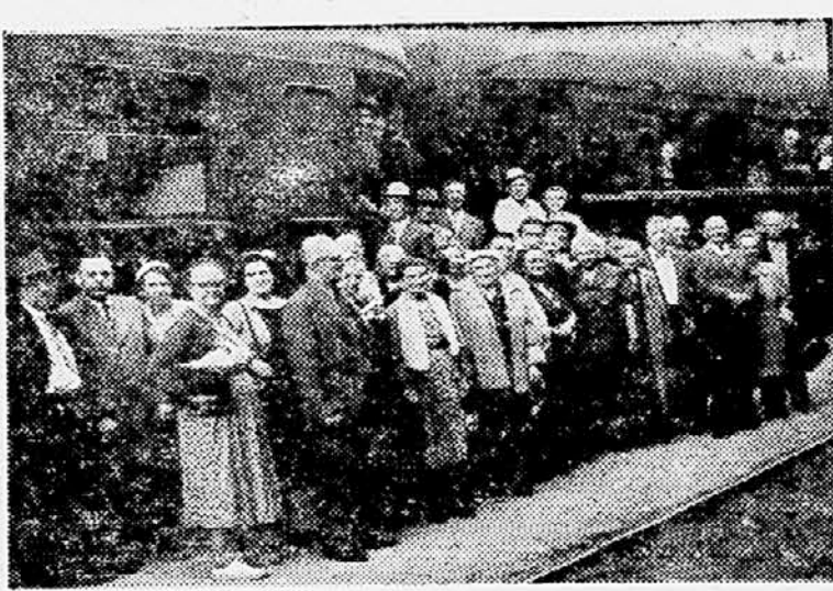
Skupina naših izseljencev iz ZDA, ki so prišli te dni na obisk v domovino.

»V Kamnik!« sem jo takoj prenenil po naglasu.