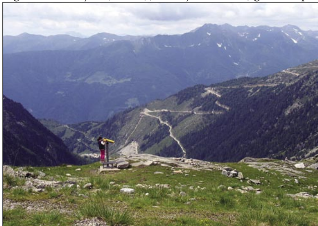
Kak drauvni je človek na sredi mogočni plamin...!

depa vekša mesta smo steli gorpoiskati kakši drügi den. Po kratkoj pauti po avtocesti smo prišli v malo vesnico Kolbnitz malo pred deseto vöro. Tau je bila naša prava sreča, vejpa je pri spaudnjoj postaji maloga cuga eške nej dosta lidi bilau. Kak je pisalo na ednoj veukoj tabli, je na