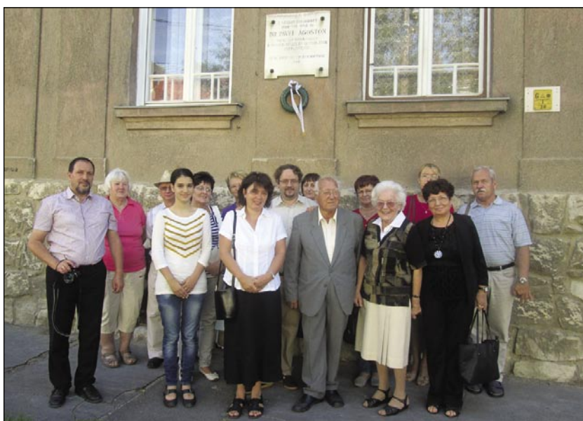
Člani slovenskoga društva pri Pavlovoj iži

Nacionalni seznam duhovne dediščine bo letos bogatejši za štiri vsebine, med temi je tudi lončarska tradicija v Őrségu, ki je sosednja pokrajina Porabja. O novih vsebinah – med njimi sta tudi ohranjanje kulta Lajosa Kossutha v Ceglédü ali čipkarska tradicija v kraju Balatonendréd – se je pred dnevi odločil minister za človeške vire, svečana razglasitev pa bo 19. septembra v okviru Dnevov kulturne dediščine. V kraju Magyarzombatfa, kjer je v Őrségu največ lončarjev, so tri leta pripravljali dokumentacijo za prijavo, ki vsebuje kakih 40 strani pisnega gradiva, 40 fotografij in 10-minutni film. Kot je povedal župan, ima v tem kraju lončarstvo več kot 700-letno tradicijo, kajti v listinah je prvič omenjeno leta 1366. Posebnost lončarstva v Őrségu je, da je skozi stoletja vsrkavalo vplive z Balkana in tudi severne Italije, ki so se potem prenašali iz roda v rod. Značilne barve so: rjava, zelena in rumena. Pred slabimi sto leti je bilo v vasi še več kot sto lončarjev, trenutno se ukvarja z lončarstvom 14 družin.