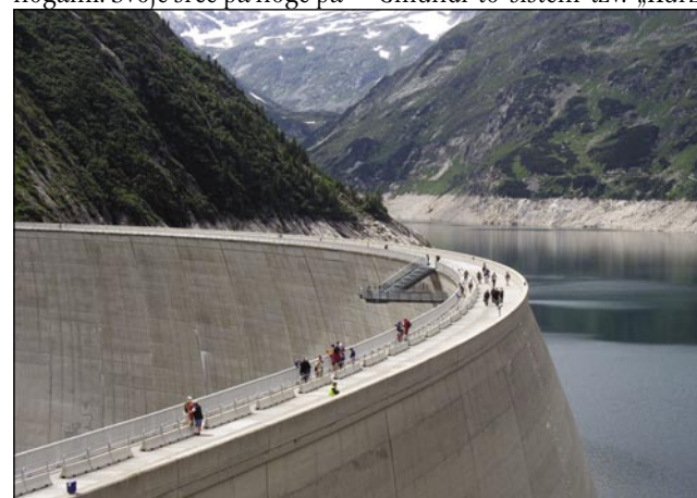
200 mejterov visiki jez - na sredi z adrenalinskim balkonom

Na konci zaglednemo eden jez (gát), šteri je viski 200 mejterov. Na té jez leko vsikši gorstaupi, vekša batrivnost pa trbej za tau, ka bi človek stau-