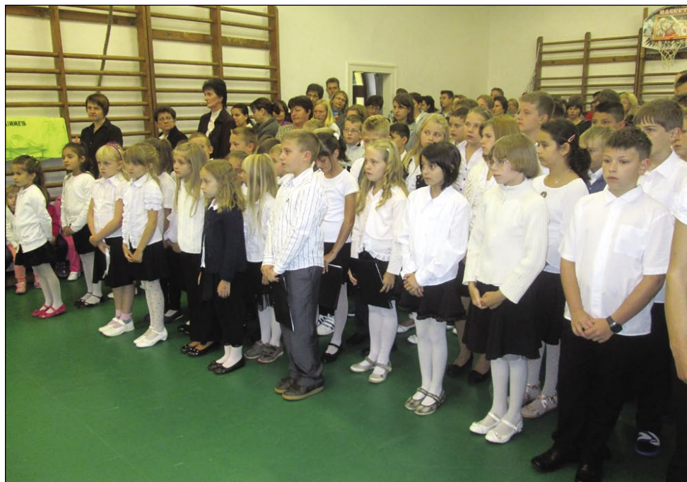
Učenci DOŠ Jožefa Košiča (Gornji Senik) na otvoritveni slovesnosti

Z dvojezičnim šolstvom pa niso povezane le ugodnosti, kot brezplačni učbeniki, vozovnice in tabori, temveč tudi obveznosti. »Kolegi, ki niso slovenskega porekla in poučujejo dvojezične predmete, morajo do