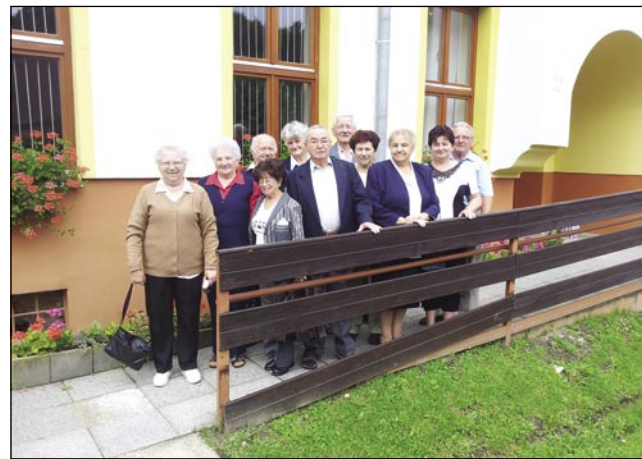
Nekdenešnji šaularge – zdaj že babice pa dejdecke – steri smo 1954. leta končali šaulo na Gorenjom Seniki

Dobili smo od nji blagoslov, za zahvalo smo njim spopejvali »Je angel Gospodov...«. Pri spomeniki, steri je postavljeni pri