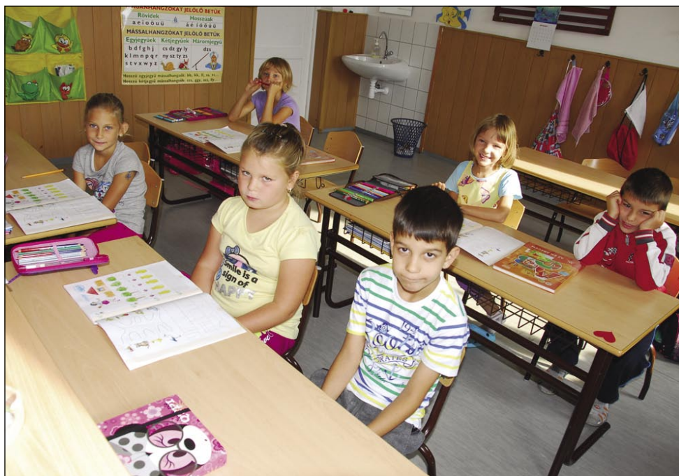
Na DOŠ Števanovci se uči letos 51 učencev, med njimi je 6 prvošolčkov

konca šolskega leta položiti izpit iz slovenščine na srednji ravni« - je opozorila Ildiko Dončec Treiber.