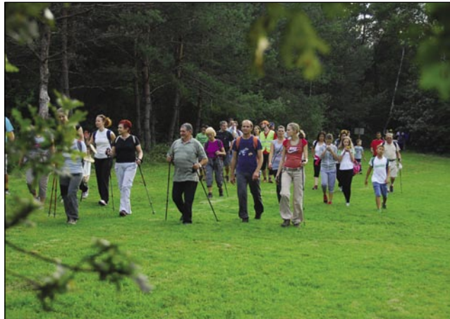
Pohodniki prihajamo v Andovce