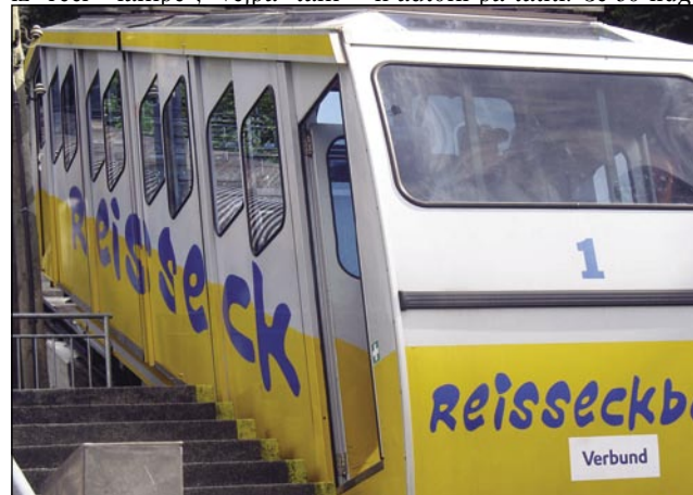
Takši mali cugi morejo meti veuko mauč, ka vlečejo tri ducate lidi

parkzon", ka znamenüje, ka za parkeranje nej trbej plačati. Človek v autoni edno papernato vöro vödeje, na šteroj pokaže, gda je prišo parkerat, gda pa cajt pretečé (30 minut, 1 vöra, 2 vöri ...), mora nazaj k autoni pa tatiti. Če so lidgé