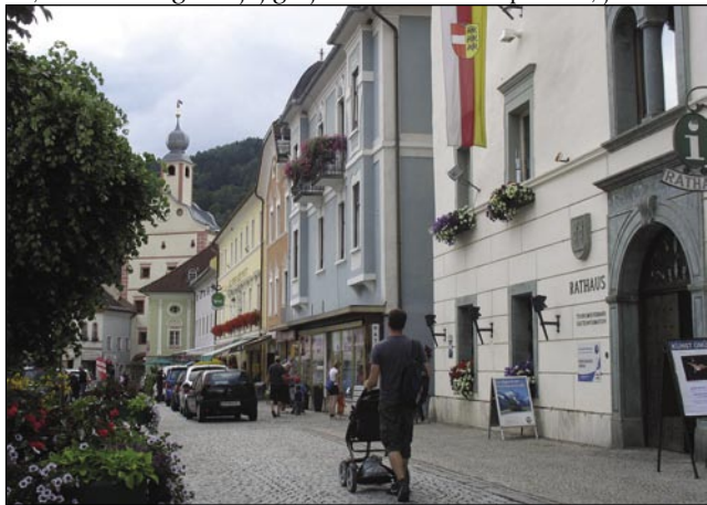
Srednjeveški varaš Gmünd zové turiste s svojimi kavarnami

Kak indri v Avstriji, majo v Gmündi tō sistem tzv. „Kurz-