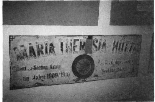
Triglavski zbirki v Mojstrani je uspelo dobiti tudi nekaj napisnih tabel, ki so bile njega dni pribite nad vrati planinskih koč v naših Alpah