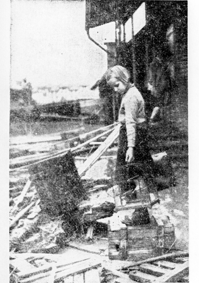
To je vse, kar je ostalo... In njeni pritoki so prestopali bregove, visoka talna voda v mestu pa je v kratkem času prodrla na dan in napolnila kletne prostore. Kmalu po polnoči je ugasnila tudi električna luč, grozila voda pa je naraščala z bližjavo naglo. Okoli tretje ure, ko je voda dosegla najvišje stanje, so bile nekatere ulice v obrobni predelni mesta, zlasti pa

Ob 23. uri so se oglasile sirene. V mestu Celju so sliene namenjale nevarnost poplav že od približno 23. ure dalje. Savinja