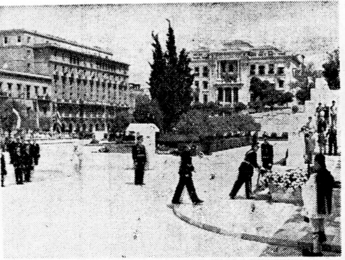
Predsednik republike Josip Broz Tito je drugi dan po svojem prihodu v Atene položil venec na grob neznanega junaka. Slika kaže predsednika Tita ob polaganju venca.

Po izstreljenih salvah je kraljeva vedeta »Alkion« odplula v častnem spremstvu motornih čolnov, in kmalu nato pristala ob fregati, kjer se je predsednik Tito, oblečen v belo maršalsko uniformo, izkrcal in se ob vzklkih »Zito, Zito« (Zivilo) v spremstvu grškega kralja Pavla popel na ladjo.