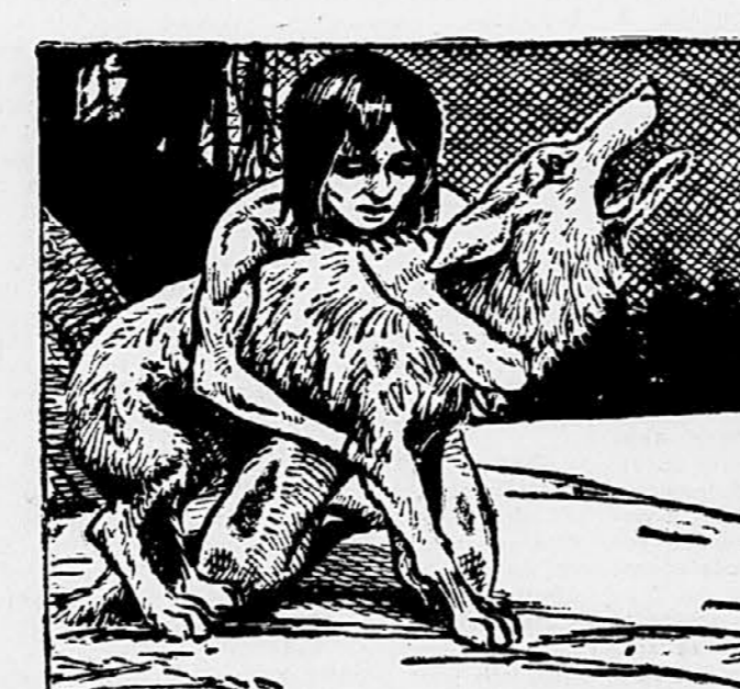
211. »Bratec, dvigni me na nogo!« je zaprosil umirajoči volk. »Tudi jaz sem bil volk svobodnega naroda!« Mavgil je nežno objel Akelo in ga postavil na nogo. Bel volk pa je globoko vzdihnil in zapel pesem smrti, ki jo mora peti vodnik krdeca, kadar umira. Pesem je naravnata in ko je izvenela v zadnji »Dober lovi«, se je volk poslednjič vsnal.