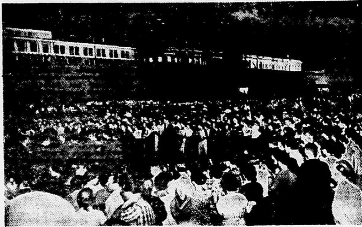
Udeleženci in gostje VI. mladinskega festivala v Moskvi so se srečali na Rdečem trgu v Moskvi. Slika kaže množico študentov in drugih mladih ljudi z vsega sveta svecem na Rdečem trgu. V ozadju je Kremelj.

V sindikalnih krogih v Parizu so danes poudarjali, da je to zvišanje nezadostno, češ da se je gornja višina cen že pred nekaj meseci dvignila za nad 20%. Večina sindikalnih central, zlasti pa katoliški sindikati in generalna konfederacija dela so spriču tega zahtevajo zvišanje minimalnih mezd za 16% ter revalorizacijo mezd v vseh plačnih razredih. Z danas-