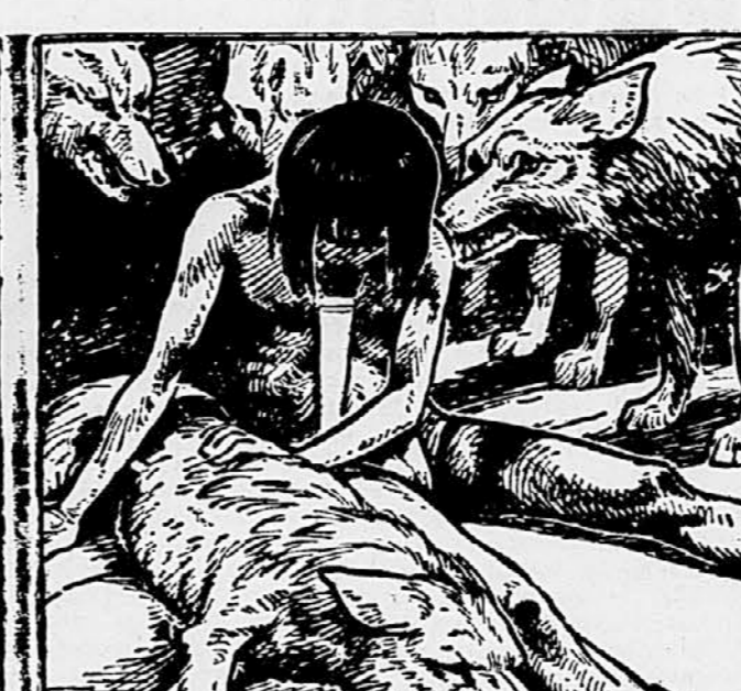
212. Skočil je kvšku in se mrtev sgrudil na svoj zadnji in najstrašnejši plen. Mavgil je sedel ob njem in prijel njegovo glavo na kolena. Volkovi — zasledovalci so pripeljali nazaj k mrtvega starcu. Čakali so, dokler ni vstalo jutro. Mavgil pa se ni zmenil zanje. Zdrnil se je šele, ko se ga je dotaknil mokri, krvavi gobec vodnika Faa.