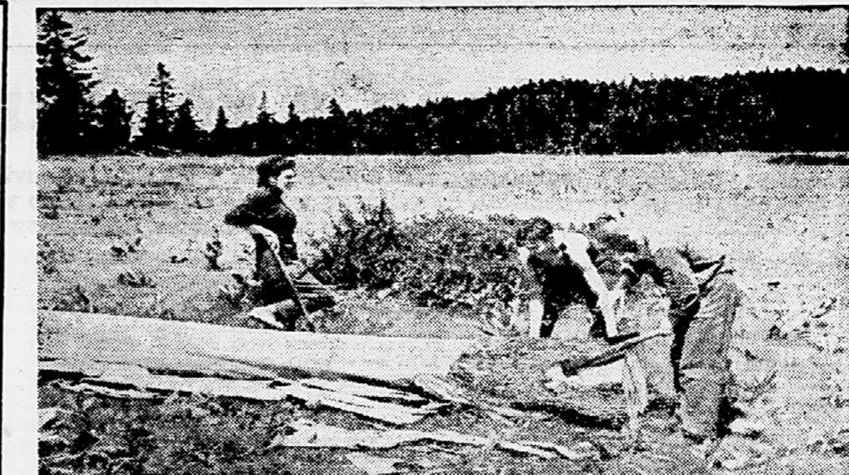
Brigada mladih združnikov iz celjskega okraja ureja pod Rogljo pašnike za gojitev mlade živine. Na sliki brigadirji pri krčenju planjave.

Letošnji investicijski program poslovne zveze v Šmarju zajema: gradnjo mlina v Mestinju z zmogljivostjo 4,5 tone na dan, nadalje gradnjo mlekarne v Kozjem s kapaciteto 1.000 litrov na dan, oziroma z možnostjo povečave na 2.000 litrov na dan in končno — gradnjo vinske kleti v Virštajnu z zmogljivostjo 40 vagonov. Medtem ko se bo gradnja mlina začela v septembru, je mlekarna v Kozjem tik pred dovršitvijo. Za vinski klet v Virštajnu pa je zaenkrat določena le lokacija.