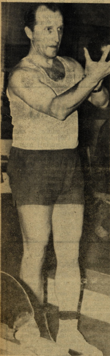
Vanošek na 2. mestu

že v tem, da so pokazali dobro voljo in tako odprli uspešnejšo pot razvoju te lepe športne pa- noge pri nas.