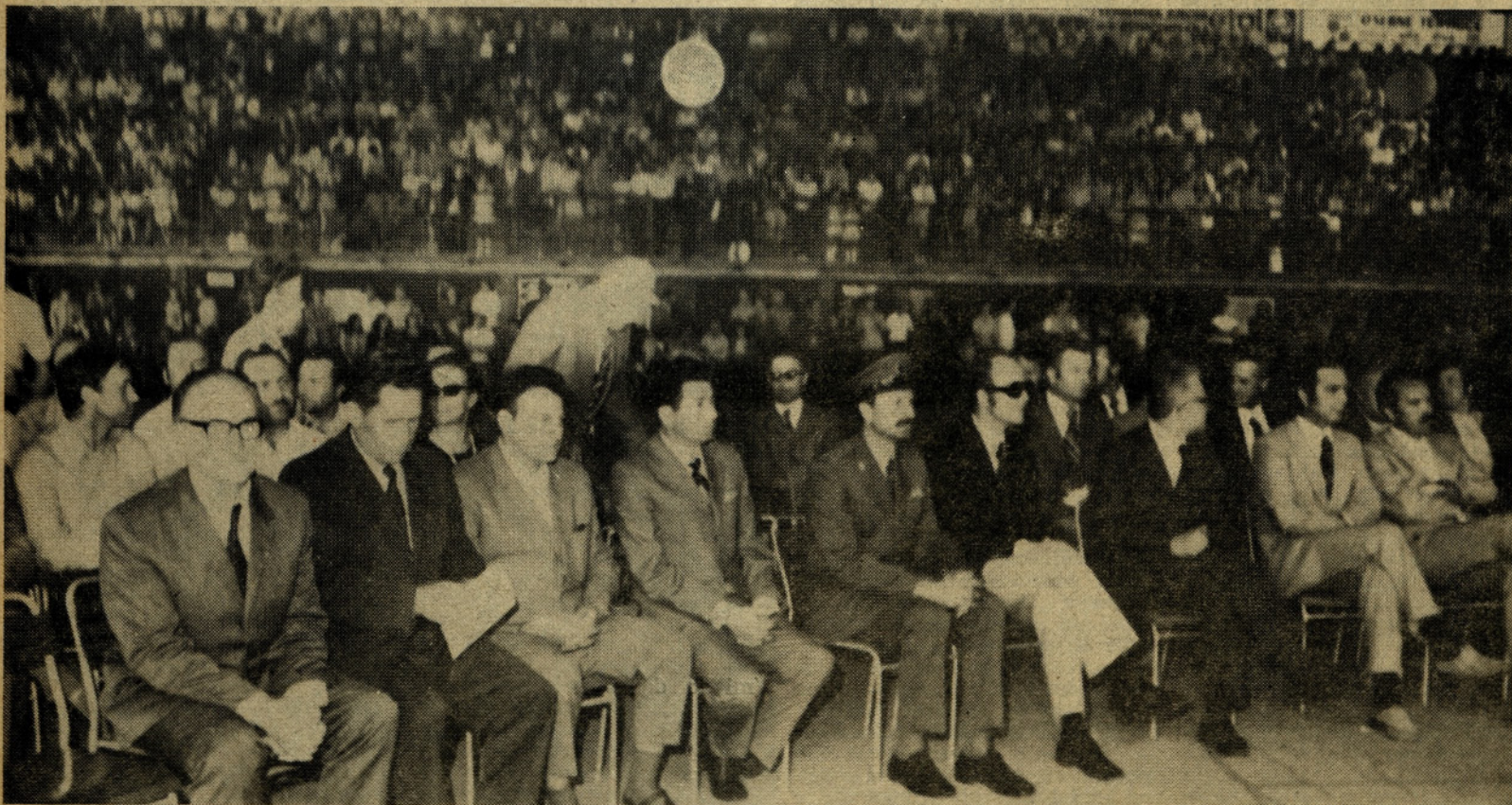
Slavnostne proslave v mestnem parku so se udeležili številni celjski in republiški predstavniki

v majhnih količinah na jeklene kotle ter radiatorje. Zanimiva pa je koncepcija, ki jo lahko analitično ugotovimo in izhaja iz samega proizvodnega programa, iz negovanja in razvoja tehnologije z izdelavo na osnovi lastnih konstrukcij najmodernejših strojev in naprav za takratne pogoje in iz načina vedno bolj uspešnega obvladovanja surovin za osnovni proizvodni program. Uskladitev vseh teh izhodiščnih pogojev, ki so bili kakor bomo videli zelo dobro zastavljeni in izpeljani, je dala možnost za raz-