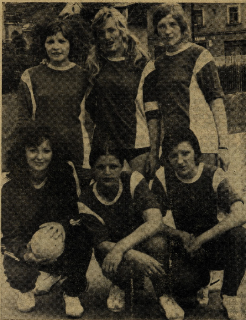
Na tekmovanjih so bile zelo uspešne tudi naše delavke

Kot kaže naši balinarji na tek- movanju niso imeli sreče ali pa je pri nas ta šport še premalo razvit. Čeprav so bili na zadnjem mestu, menimo da so bili uspešni