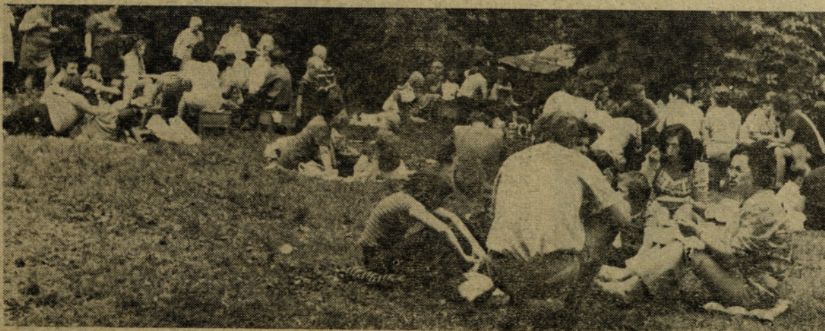
Piknik na proslavi v mestnem parku dne 4. julija

Današnje praznovanje pa je pomembno še po nečem. Pred tednom dni je bil namreč podpisan samoupravni sporazum o združevanju dela in sredstev med »Iskro« in »Gorenjem«, s čimer je bila uspešno zaključena temeljito pripravljena povezava dveh slovenskih industrijskih orjakov. To nedvomno pomeni že tudi odločen korak v uresničevanju sklepov slovenskega in jugoslovanskega kongresa