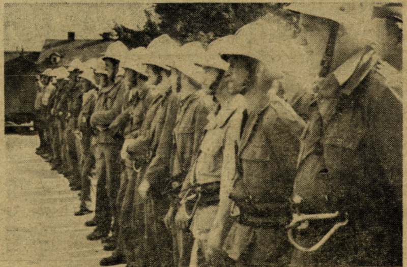
Naši vrli gasilci v »bojni« pripravljnosti