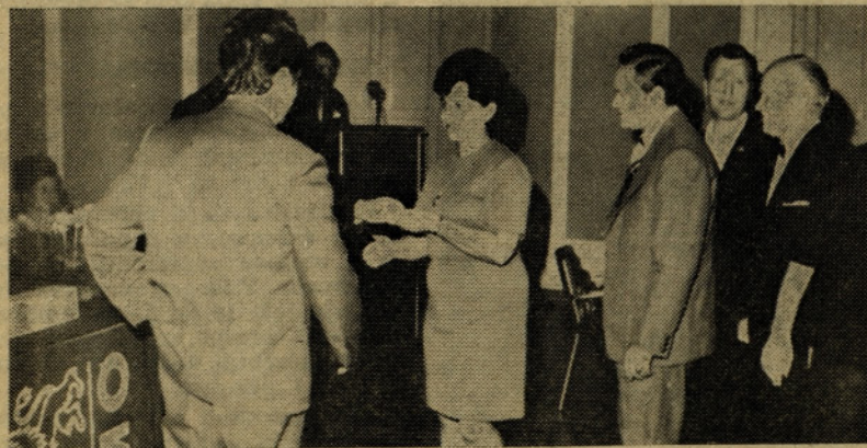
Zaslужni delavci so na slavnostni seji DS prejeli zlate značke

Poslovni odbor do 15. julija o predlogu še ni razpravljal in sprejel določenega sklepa. Potres je bil dne 20. 6. 1974 in čas kaj hitro beži. Porušeni dimniki in stanovanja čakajo popravila in upajmo, da bodo to dočakali še pred letošnjo zimo.