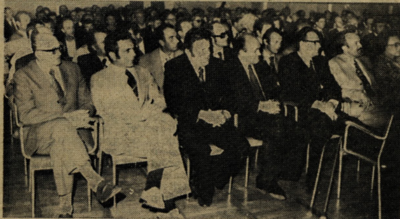
Naši gostje na slavnostni seji DS

Prve izkušnje dokazujejo, da so bila naša predvidevanja na osnovi analiz točna in utemeljena. Ugotovimo lahko tudi, da je notranja konsolidacija možna kljub temu, da smo se morali pri izrazitem notranjem pesimizmu praktično boriti celo leto, da smo pričeli s koriščenjem sredstev za sanacijo, t. j. modernizacijo. Ugotovljamo lahko tudi, da je ob notranji konsolidaciji EMO