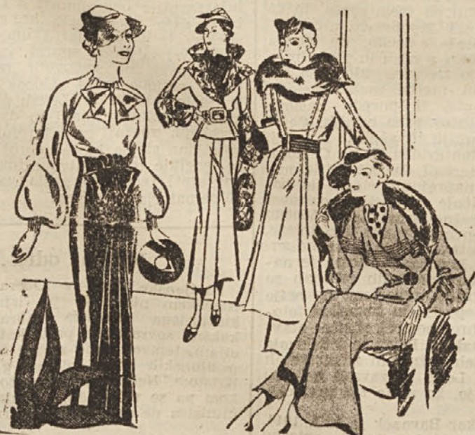
Modni utrinki za hladnejši letni čas

V jesenski modi ima žamet pomembno vlogo ter izpodriva celo volno in svilo ter kratko dila- kasto kožuho. Vendar pa ostaja še zmerom dovolj mesta za kožuho in plaščih, oblekah in kostumih. Pri elegantnejših oblekah se razprostirajo velike ploskve perzijanca ali ostriznega jagnjeta čez velik ovratnik in čez široke nabrane rokave. Kako lep okras tvorita po dve lisici na popoldanskem plašču enotnega kroja. Zanimivo je v sredini nabrano krilo iz žameta ali Cloque, ki je posebno primerno za popoldne. Pri tem ne smemo pozabiti slikovitega baretla, torbice v obliki diska in ročno torbico iz istega blaga. Paziti moramo na te malenkosti, ker so tudi pr: najpreprostejši obleki največje važnosti in pogosto čudovito učinkujejo tako v dobrem kakor v slabem smislu.