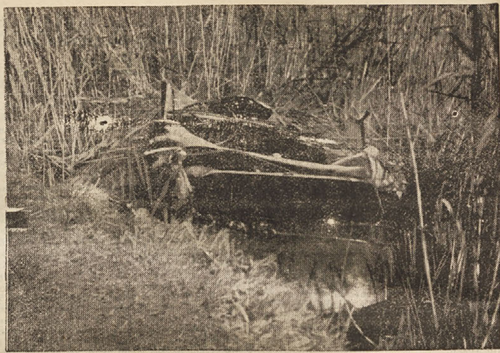
Usodni avtomobil v Vierwaldstättskem jezeru Prva slika grozne nesreče, ki je zadela belgijsko kraljevsko hišo. Na sliki je videti v jezersko bičevje zarilo vozilo, ki je prineslo kraljici Aristidi smrt.

Prihodnjic pa še kaj veselega o vseh ostalih.