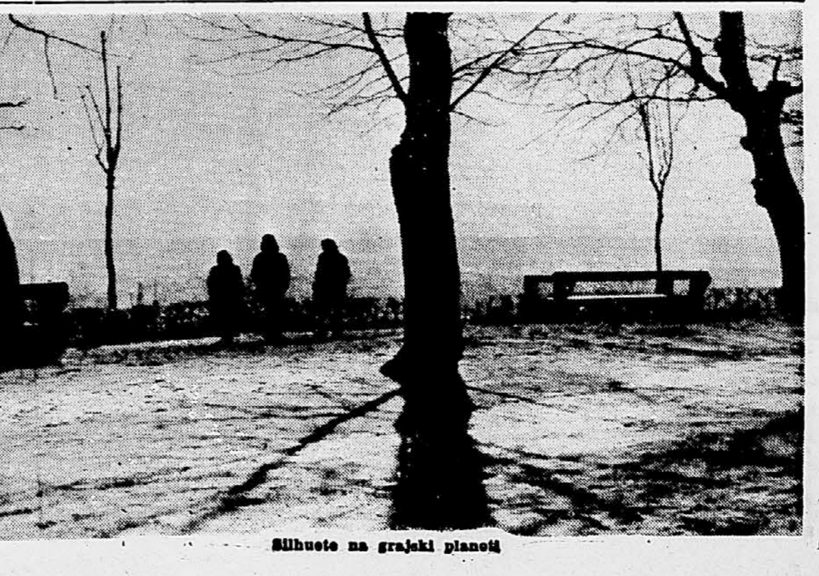
Silhuete na grajski planoti

Eisenhower misli povabiti predstavnike indije na obisk v ZDA New York, 11. marca. (Tanjug.) Današnji »New York Herald Tribune« objavlja vest, da bo predsednik Eisenhower, v kolikor zmaga na bodočih volitvah, takoj povabil predsednika indijske vlade in ministra za zunanje zadeve Nehruja na obisk v ZDA.