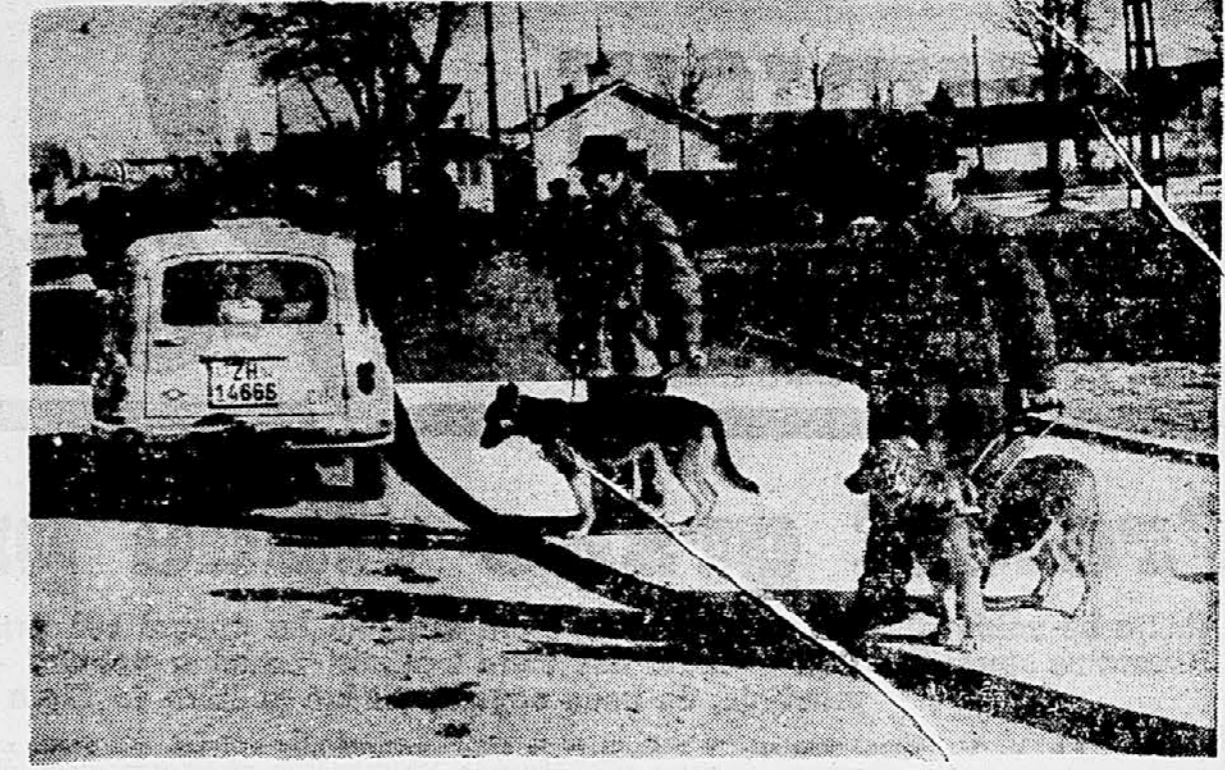
Dreserji vadijo pse vodiče, ki bodo v pomoč slepim pri hoji po prometnih ulicah

Organizacija ZB je v preteklem letu posvečala veliko skrb otrokom padlih borcev. Lani je letovalo ob morju in drugje 497 otrok, za kar so porabili nekaj manj kot 4 milijone dinarjev. Stipendijo prejema 865 otrok. Učni uspehi teh otrok so veliko boljše od povprečja. Temu vprašanju je namreč organizacija ZB posvečala kar največ pozornosti. V bodoče bo treba, da bodo borec pogostje obiskovali otroke padlih borcev in se zanimali, v kakšnih pogojih žive in se učijo, kako ravnajo z njimi: skrbniki itd. Konferenca je ugotovila, da je ZB zasavskega okraja veliko storila za to, da velika dejanja iz bližnje preteklosti ne bi šla v pozabo. Lani je organizirala 26 partizanskih patrolj, ki so obiskovale kraje partizanske krake. Sodelovala je tudi pri organiziranju občinskih praznikov. Zbiranje zgodovinskega gradiva je bilo najbolj uspešno v Trbovljah in Zavrčju. Muzej MOJ v Trbovropagandnim materialom in ljanj so lani obogatili z raznim gradivom, ki so ga zbrali borci. Delegati so za to, ko so govorili o liku člana ZB, o izven-