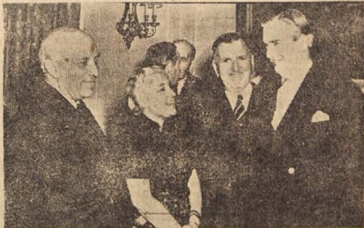
Džavaharlal Nehru in Vidja Pandit v gosteh pri angleškem zunanjem ministru Anthonyu Edenu

Bonn, 8. febr. (DPA). Predsednik nemške socialnodemokratske stranke Ollenhauer je odpotoval danes v London, kjer bo sodeloval na seji tajništva Socialistične internacionale. Nemara bo navezal stike tudi s predsednikom indijske vlade Nehrujem, ki se muči v Londonu na konferenci Britanske skupnosti.