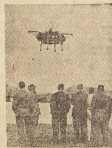
To nenavadno letalno napravo imenujejo v Veliki Britaniji »Leteca postelja«. Nima ne kril ne propelerjev in vzlet iz vodoravnega položaja vertikalno v zrak. Poganjata ga dva reaktivna motorja. Pilot sedi nad obema motorjema in uravnava to čudno stvar

tonsko letalonosilko, ki bi jo ZDA uporabile predvsem v vojni z atomskimi bombami. Temu dovoljenju so takoj sledili srditi napadi na obrambnega ministra Forrestala, ki so mu odpovedali živci, da se je odločil za samomor. Truman je sicer dovolil zgraditi novo letalonosilko, toda odpor vojnega letalstva, ki meni, da bi lahko samo zmoglo vojno atomskimi bombami s težkimi bombniki B-36, je bil čeda. Je hušji in uspešnejši, dokler se niso pojavili med vojno na Koreji dvomi glede odločitve v zraku in dokler ni tornado v Texasu v nekaj urah uničil celega zračnega ladjevja letal B-36. S tem je bila ovržena trditev, da je premoč na strani le-