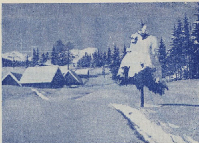
Tak je bil naš Božič doma

DOZIVET SVETI VEČER, USPEHA IN BLAGOSLOVA V NOVEM LETU 1959