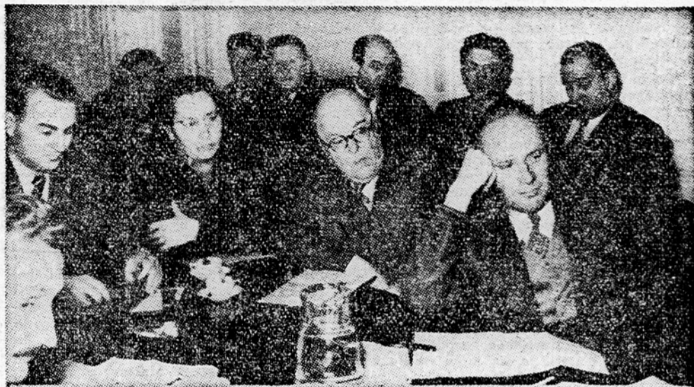
Seja komisije za izdelavo poslovnika zvezne ljudske skupščine

V podrobni razpravi so živahno sodelovali vsi člani odbora. Skladno z načelno razpravo so bile vnešene ustrezajoče spremembe pri posameznih členih.