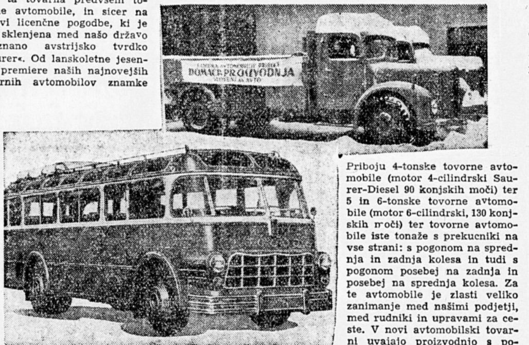
Zgoraj: dva iz kolone osmih 6-tonskih tovrstnih avtomobilov iz Priboja, ki so jih pripeljali v Ljubljano na zadnji dan starega leta; spodaj: moderni »Saurer« avtomobili, ki bodo tudi tega bomo že v kratkem občudovali v Ljubljani

Umetnica je na razstavi zbrala štirinajst olj, med katerimi prevladujejo portreti in tihotižja. Njene značilnosti so posebno vidne v držnih barvnih prijemih, pa tudi v vsebini iz prihaja do izraza osebno življenjsko občutje. Razstava je zanimiva zlasti v času, ko tudi pri nas opažamo vsakovrstna iskanja in poživljeno prizadevanje v likovnem izrazu.