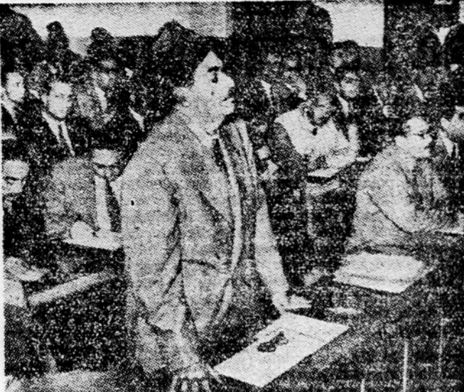
Serag el Din, bivši generalni sekretar vladstvene stranke ter bivši notranji in finančni minister, se mora zagovarjati pred egiptovskim revolucionarnim sodiščem. Obtožen je veleizdaje in zlorabe položaja in oblasti