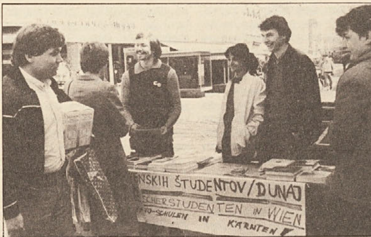
KSŠŠD je pobiral na celovškem Starem trgu podpise proti apartheidu.

Kakšna zna biti koroška dežela in koroška mentaliteta, smo spet enkrat videli v četrtek, 26. aprila. Na Starem trgu v Celovcu smo stali z našo mizo ter pobirali pod-