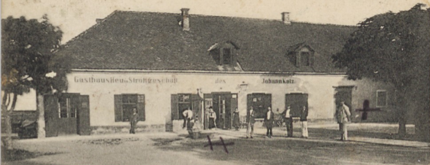
Johann Katz Gasthof.