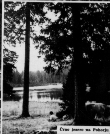
Crno Jezero na Pohorju