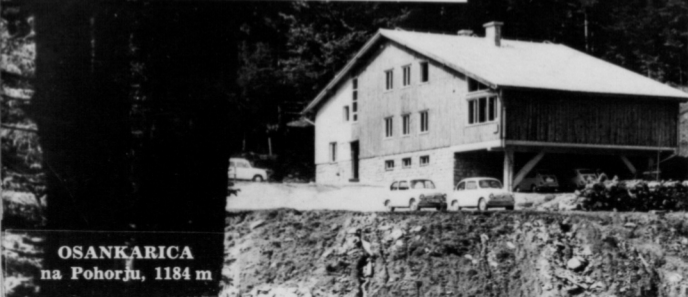
OSANKARICA na Pohorju, 1184 m