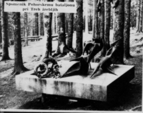
Spomenik Pohorskemu bataljonu pri Treh žrebljih