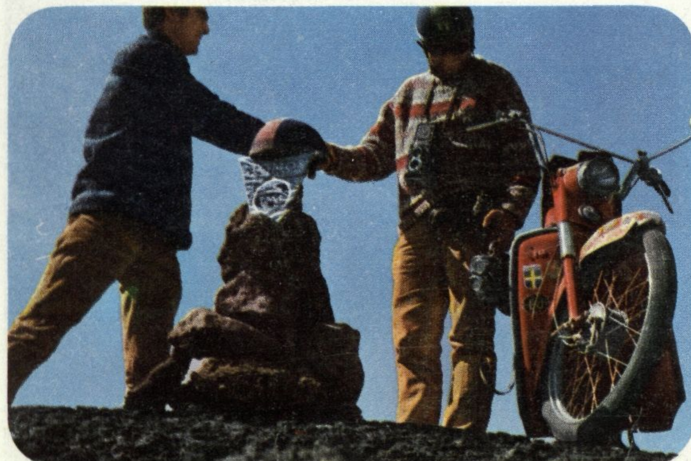
Srdačni stisak ruke za grenlandski vrh, osvojen mopedom