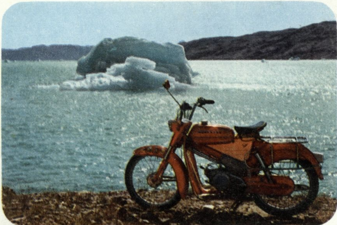
Severna mora puna su ovakvih ledenih santi