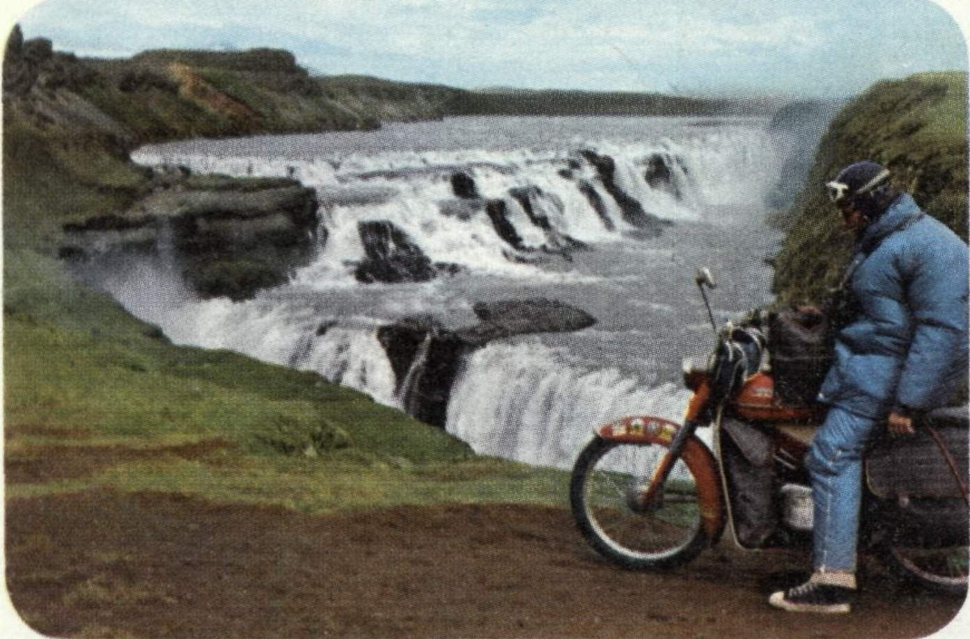
Ledeni islandski slapovi prilično se razlikuju od evropskih

Motor je dvotaktni, radne zapremine 50 ccm, vazdušno hladjen, snage 2,5 KS, ima tri brzine, troši 2,1 litra goriva na 100 km, savladjuje uspone do 20%, ima visoki upravljač, koji omogućava udobnije držanje i ublažuje vibracije u vožnji po slabim putevima. Dozvoljeno opterećenje mopeda je 150 kg.