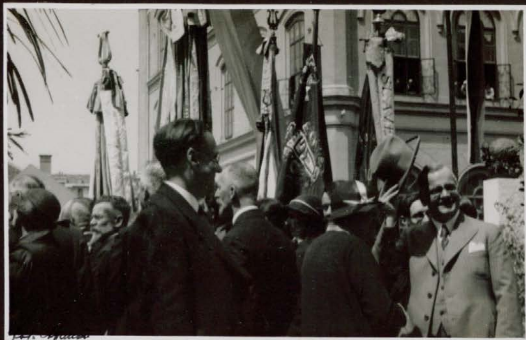
Občinstvo pri odkritju