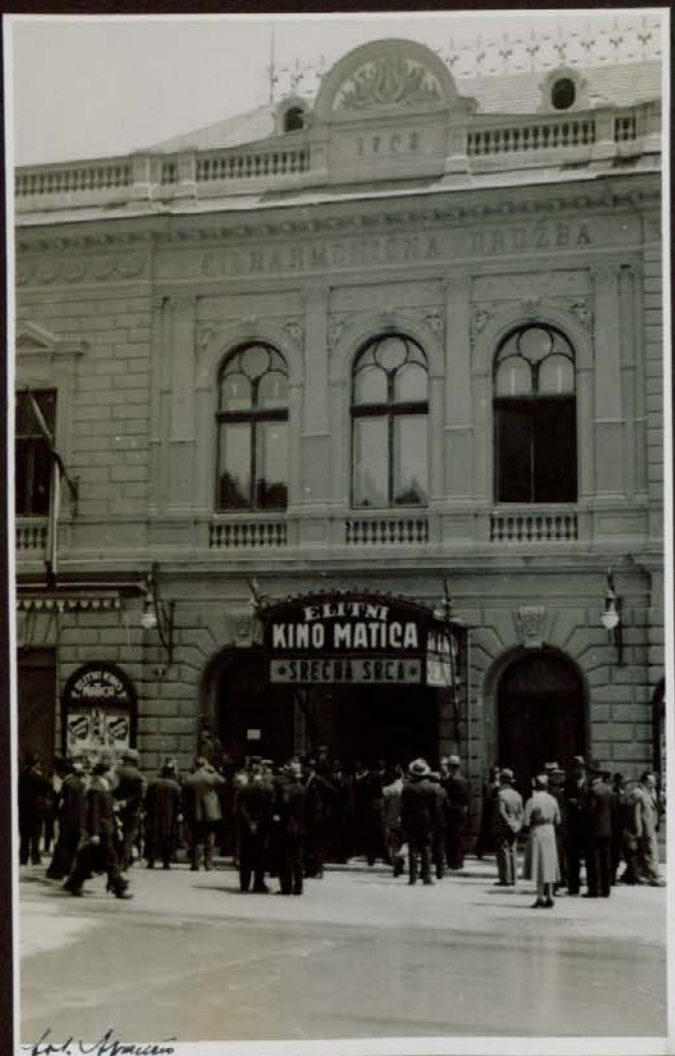
Poslopie Filharmonične družbe