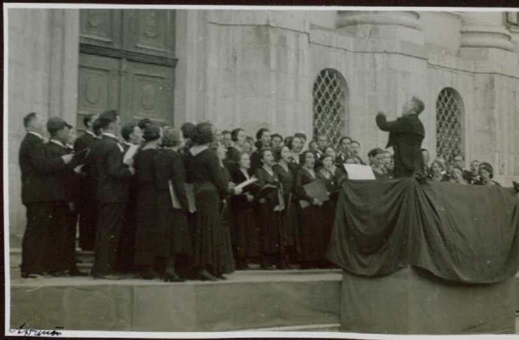
Učiteljski pevski zbor pred Nunsko cerkvijo