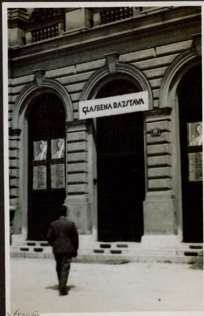
Vhod v Narodni dom