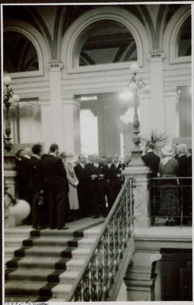
Otvoritev glasbene razstave