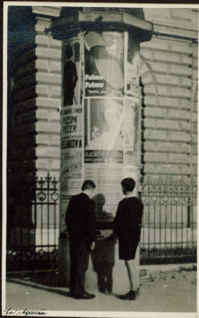
Po cerkvenem koncertu