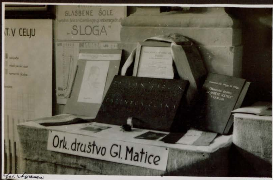
Orkestralno društvo na razstavi