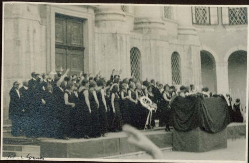
Praško „Hlahol“ pred Nunsko cerkvijo