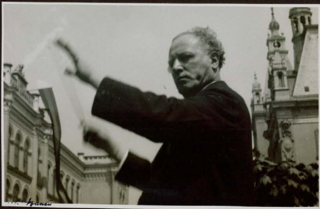
Godba pozdravlja zastopnika kralja