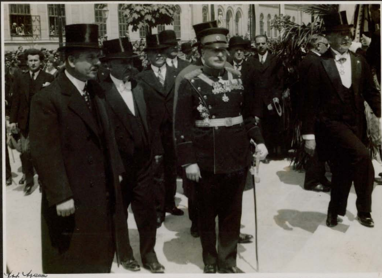
Najvišji zastopniki v sprevodu