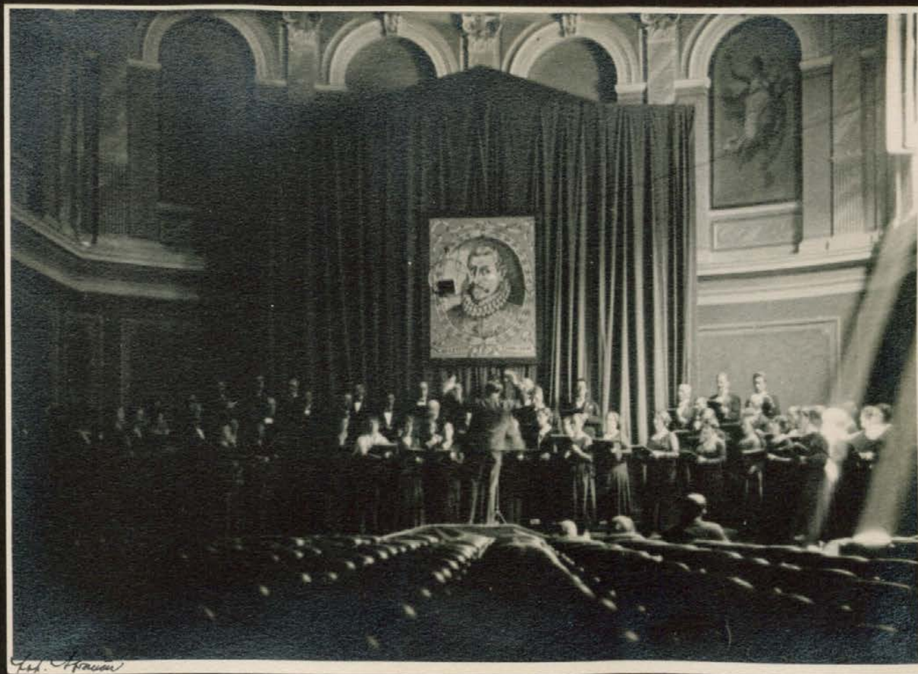
Skušnja za Gallusov koncert