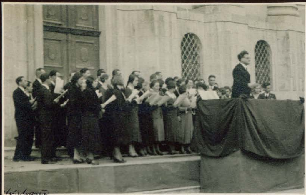
"Lisinski" pred Nunsko cerkvijo