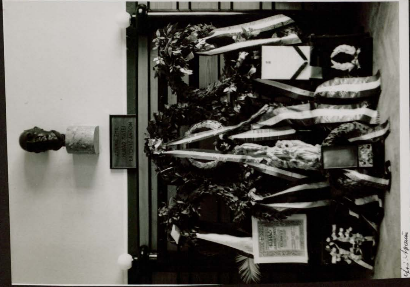
Venci izročeni Glasbeni Matici na občnem zboru.