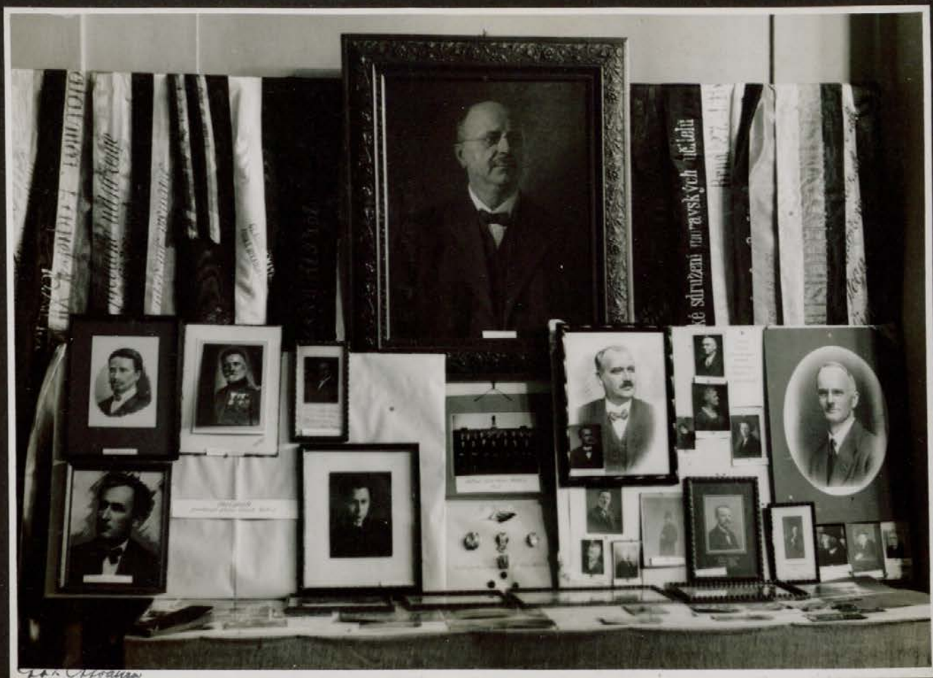
Oddělek pěvskeqa zbora Glasb. Matice na razstavi