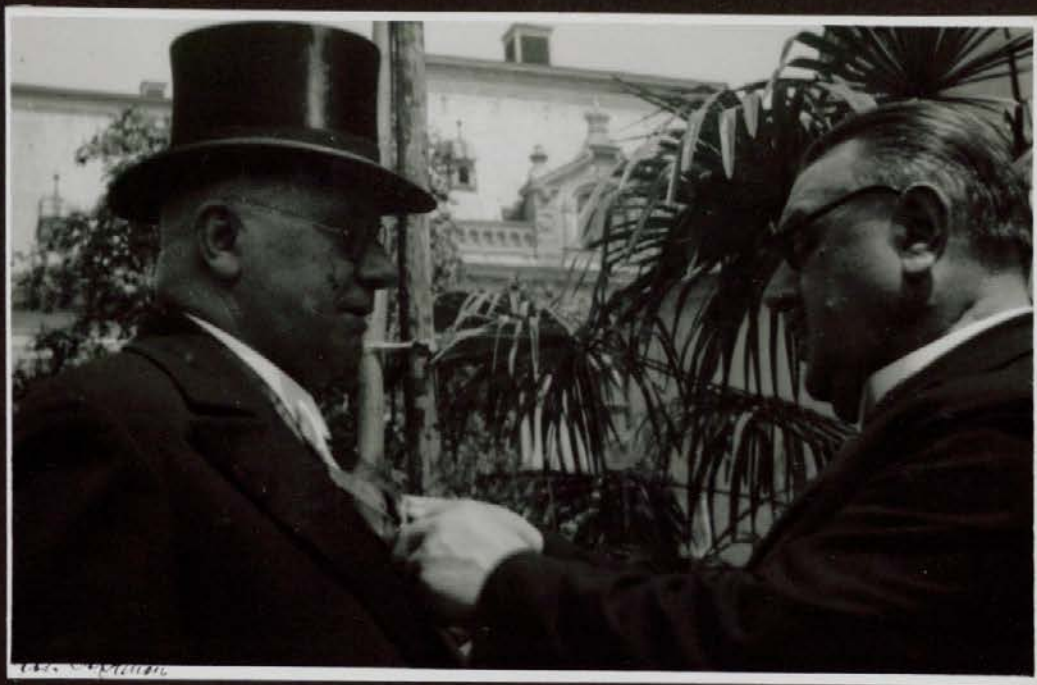
Ravnatelj Hubad in Mahkota