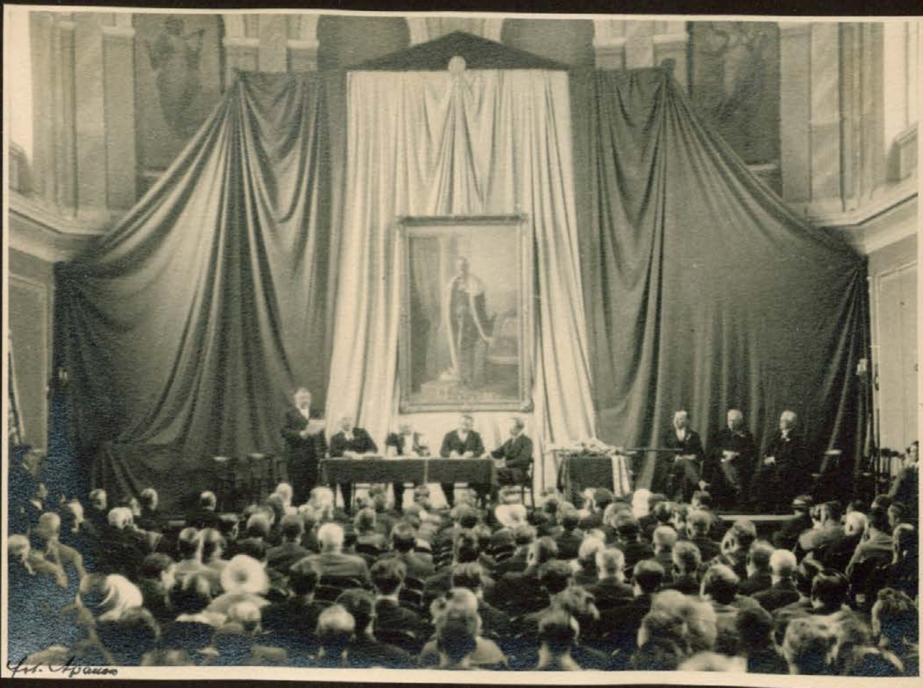
Slavnostni občni zbor v Filharmonični dvorani