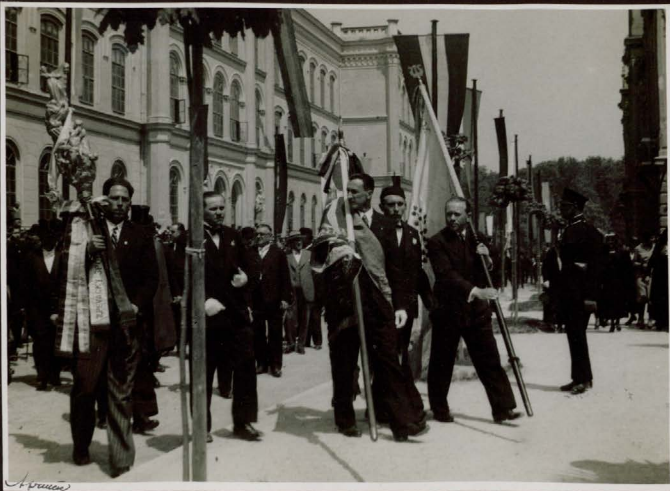
Čelo sprevoda k odkritju spomenikov