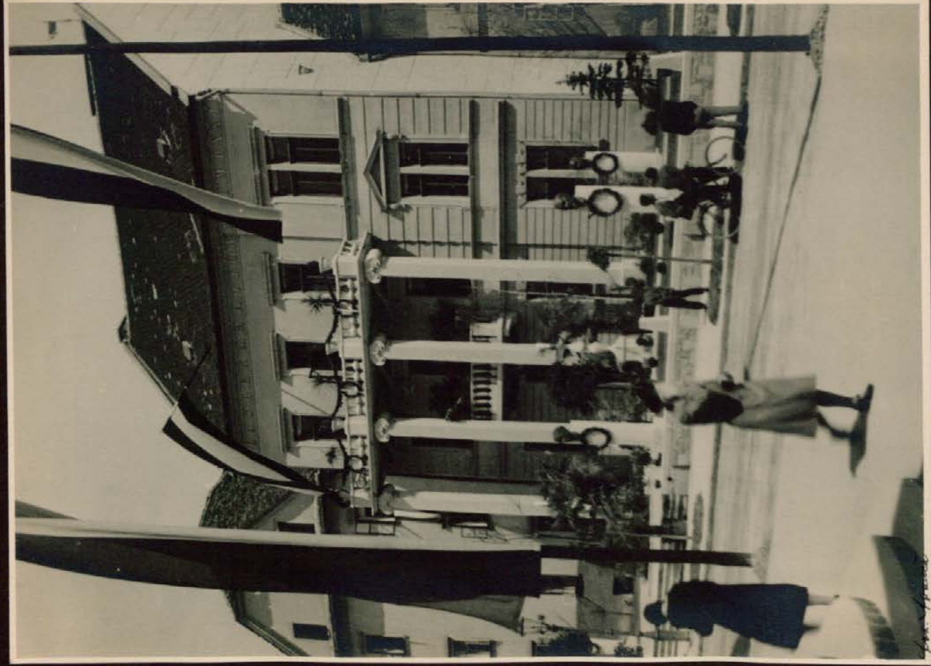
Poslopje Glasbene Matice ob slavnostnih dneh