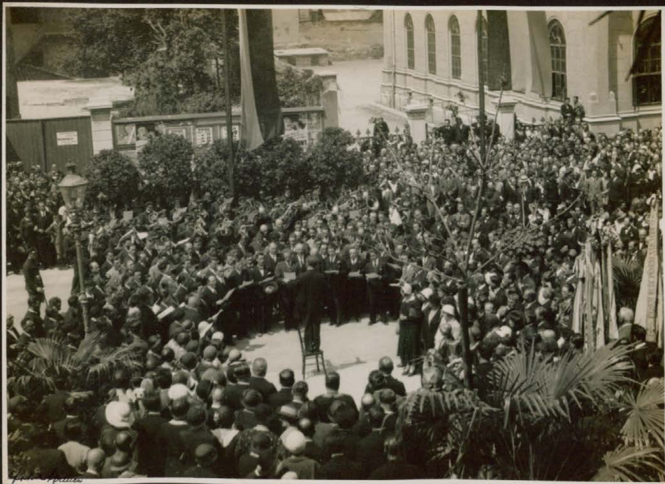
Moški zbor Hubadove župe pri odkritju spomenikov