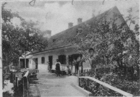
Gemischtwarenhandlung H. Lerch.

Csótörtéki Kárháidat megkap- tam. Igen öröfök, hogy térs köfön ott leny, igaztáffel mi nél jobban nyorakoltamni.