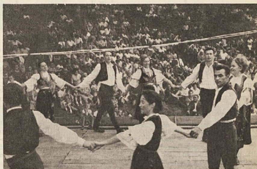
Osrednja kulturna prireditev v okviru letošnjega festivala Dela v Dolini je bila v nedeljo, 4. avgusta. Nastopila sta: folklorna skupina Delavskega prosvetnega društva Tone Cufar z Jesenic, ki je izvajala ples in pesmi jugoslovanskih narodov. Igrala je tudi domača godba na pihalu. (Na sliki: folklorna skupina z Jesenic)

Prosvetno društvo Tabor bo ob 100-letnici openske čitalnice izdalo posebno brošuro, v kateri bo opisano kakšno je bilo življenje na Opčinah nekoč. V brošuri bodo objavljeni tudi nekateri zelo zanimivi dokumenti.