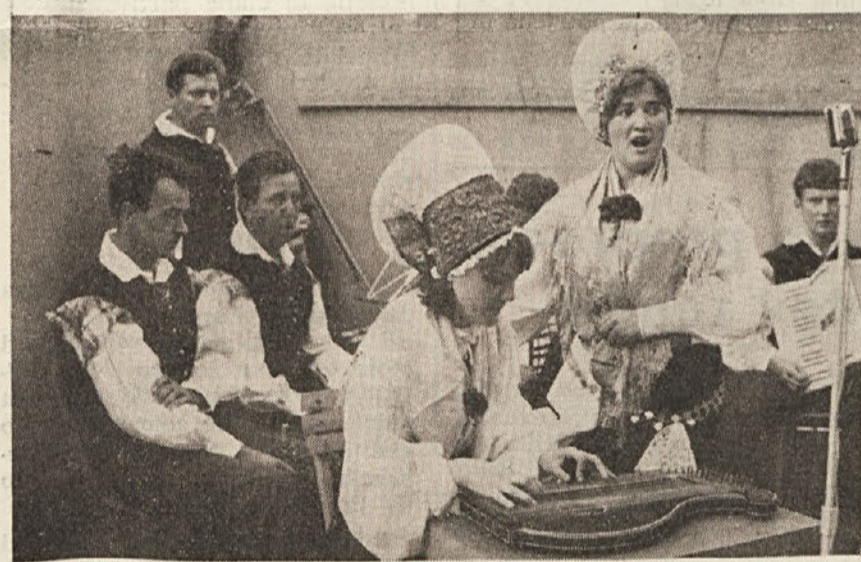
Se ena slika z dolinskega festivala Dela. Duet z Jesenic izvaja koroške narodne pesmi.